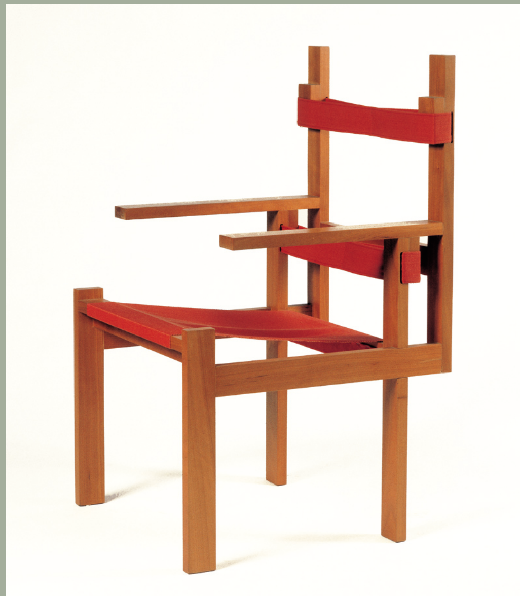
1A karosszék, 1924 Slatted chair ti 1A, 1924

Sketches, floor plans and a huge number of photographs help to summarize the main creative elements and construction principles that characterize both his buildings and his furniture which is still being produced.