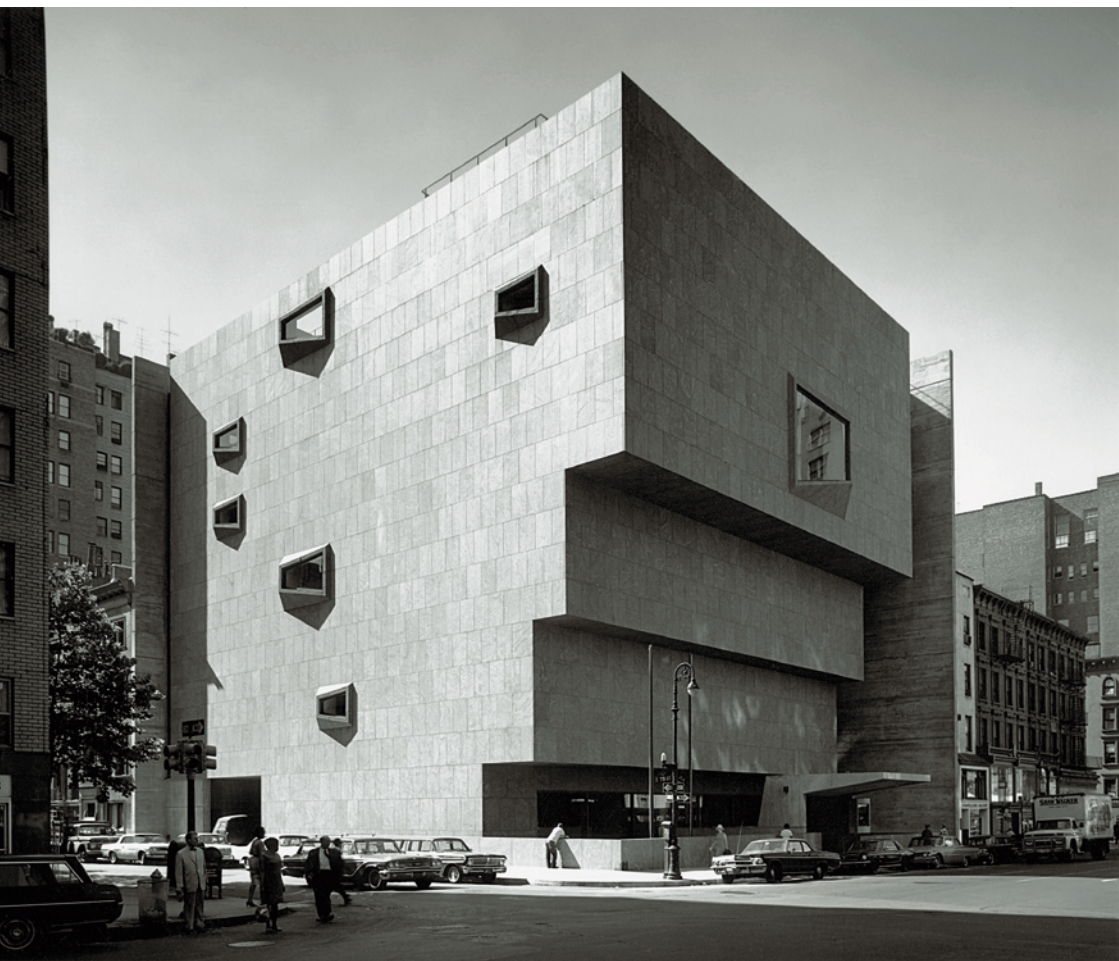
Az Amerikai Művészet Whitney Múzeuma, New York, 1964–66 Whitney Museum of American Art, New York, 1964–66