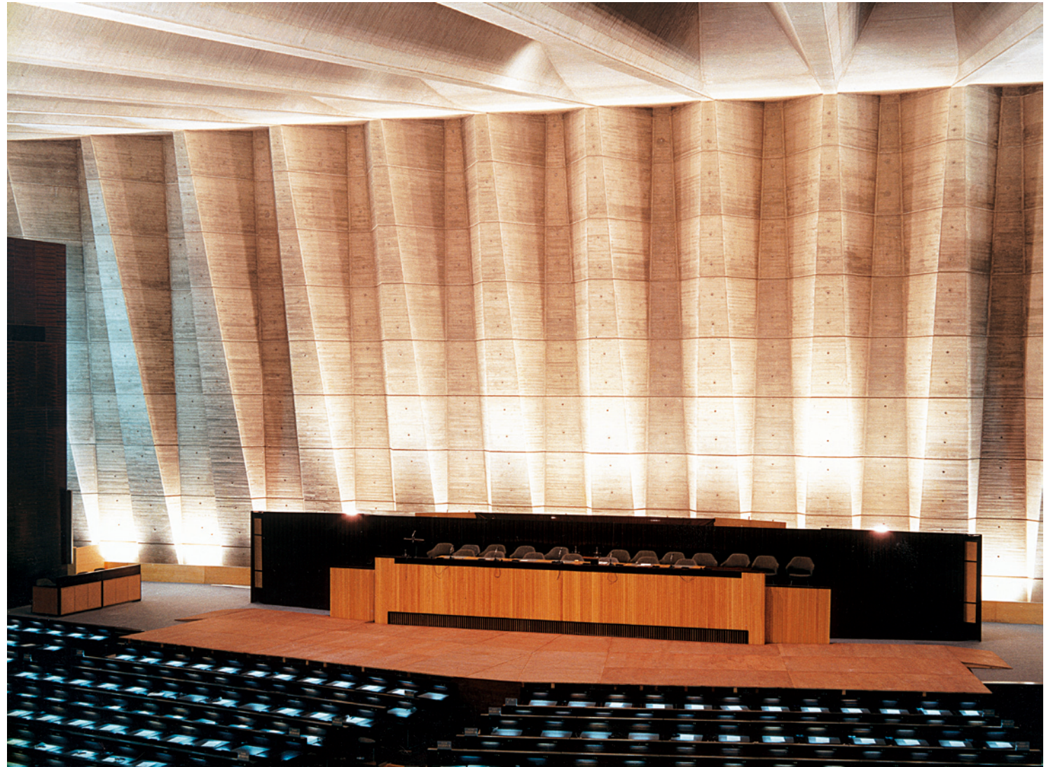
Gyűlésterem, Unesco-székház, Párizs, 1955–58 Assembly hall of the UNESCO Headquarters, Paris, 1955–58

After ten years of teaching, he recommenced his architectural activity. At first, he worked in the office of Gropius, but in 1944 he opened his own bureau. It was at this time that his international career as an architect began, stretching from residential work to churches. He was awarded the golden medal of the French Academy of Architecture, made honorary