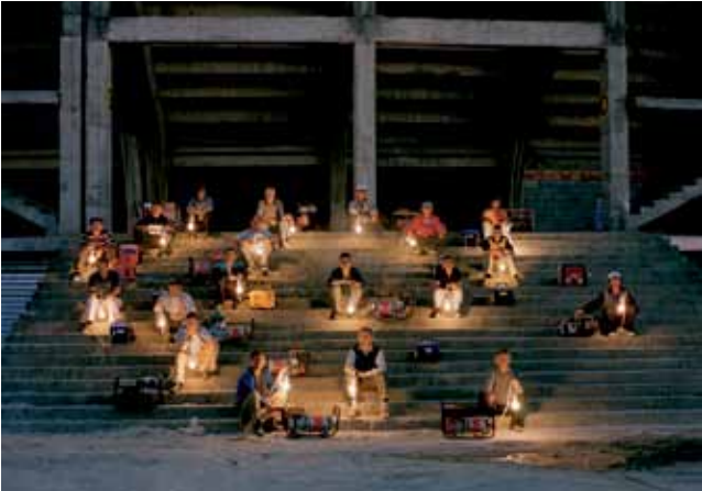
Adrian Paci: Turn on , 2004, videó, 3´33´

A kiállításon szereplő, huszonegy videoművészeti alkotás ezt a konfliktusokkal terhelt régiót és időszakot dokumentálja, elemzi és kontextualizálja. Az erősen társadalomkritikus művek végleges válaszok helyett olyan kérdéseket feszegetnek, melyeket a régió országai a nyilvános közbeszédben többnyire megkerültek vagy szőnyeg alá söpörtek.