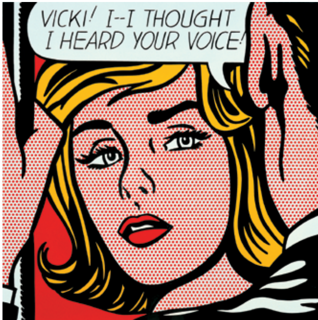
Roy Lichtenstein: Vicki , 1964, zománc, acéllemez, 106,5 x 106,5 x 5 cm, az aacheni Peter und Irene Ludwig Stiftung letéje

Ingyenes tárlatvezetések: csütörtökönként 18.00 órától, szombatonként 16.00 órától