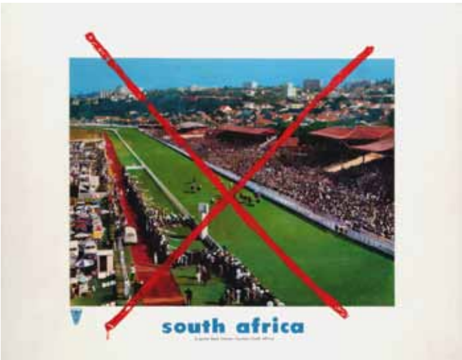
Malcolm Morley: Lóversenypálya (Dél-Afrika), 1970, akril, vász, akrilgyanta, vászon, 177,8 x 228,6 cm

A múzeum gyűjteményének alapját Peter és Irene Ludwig adománya teremtette meg, amely a hatvanas-nyolcvanas évek nemzetközi művészeinek (pl. Warhol, Lichtenstein, Rauschenberg) munkáiból állt. Azóta a gyűjtenény folyamatosan gyarapodik a legjelentősebb hazai és a közép-kelet-európai művészek alkotásaival. A Múzeum fontos küldetése a „leletmentés”: a hatvanas, hetvenes évek progresszív tendenciához tartozó életművek felkutatása, feldolgozása és az alkotások gyűjteményi elhelyezése.