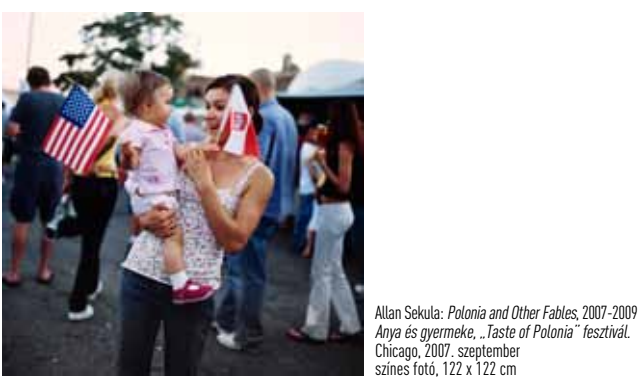
Allan Sekula: Polonia and Other Fables, 2007-2009