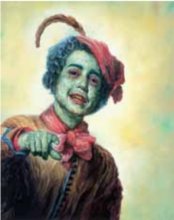
Glenn Brown: The Great Masturbator (A nagy maszturbáló), 2006, olaj, panel, 110 x 88 cm The Sander Collection © Glenn Brown

Glenn Brown (Hexam, 1966), a kilencvenes években a brit művészeti életbe berobbant generáció egyik legsikeresebb alakja a festészetet mint témát állítja vizsgálódásának középpontjába. A művészettörténet ismert és kevésbé ismert alkotásait vagy a populáris kultúra képeit reprodukálja nagyméretű festményein. Korokat, stílusokat kever, virtuóz technikával, pasztózus ecsetvonás-effekkel állít elő tükörsíma felületű képeket, egyszerre utalva a művészettörténet nagy alkotásainak kanonizált voltára és az egyedi műalkotások és reprodukcióik összetett viszonyára.