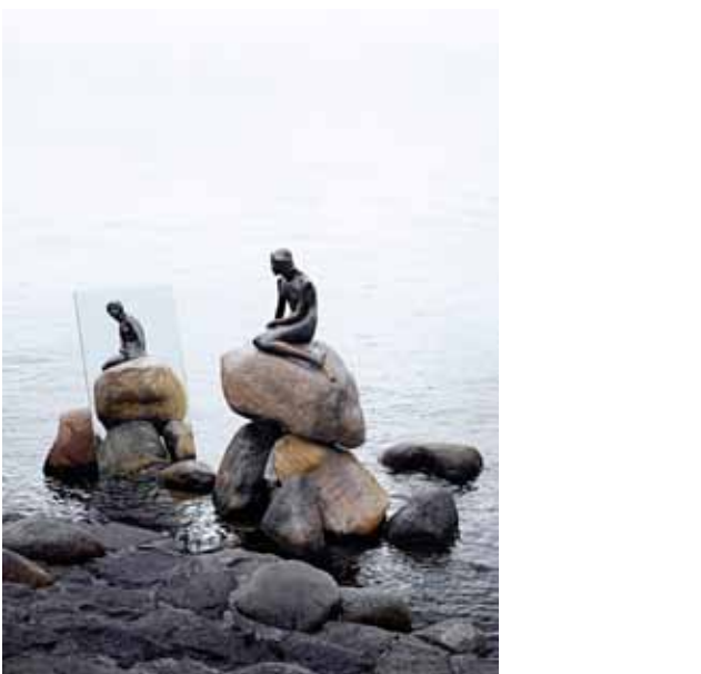
Michael Elmgreen &amp; Ingar Dragset: Amikar egy ország szerelembe esik önmagával, 2008 Louisiana Museum of Modern Art. © Elmgreen &amp; Dragset; Edvard Eriksen

Arra szeretne rákérdezni, mit gondolunk ma nemzeti identitásról, toleranciáról, felelős társadalmi és politikai gondolkodásról, és milyen szerepe lehet ebben a kortárs művészetnek. Számos kérdést jár körbe a személyiségi jogoktól, a hatalom elosztásától és az identitás társadalmi konstrukciójától kezdve a gazdasággal és a klímaváltozással összefüggő problémákon át a nyilvános és a privát tér között húzódó határvonal meghatározásáig. Reflektálni kíván a nacionalizmus kérdésére, a történelem és az emlékezet kapcsolatára, illetve arra, hogy hogyan hat egymásra e két jelenség, mennyiben konstruáltak rájuk vonatkozó fogalmaink.