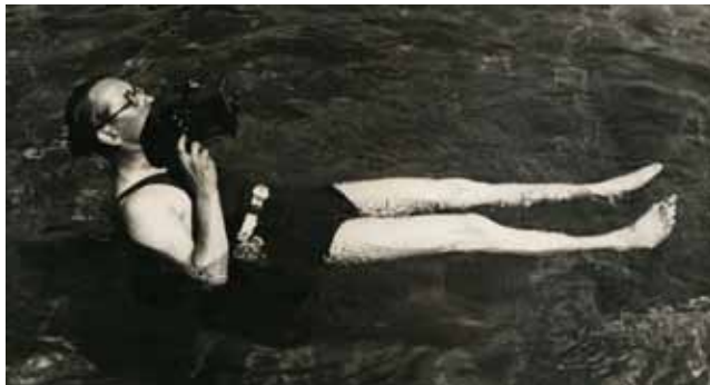
Martin Munkácsi: Exponálni minden áron, Long Island , fotó, 1935

Az 1940 és 1946 között készített, 65 riportból álló Hogyan él Amerika? című sorozata az amerikaiak legkülönbözőbb társadalmi rétegeinek hétköznapi életéről készült mélyreható képriport.