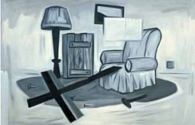
Gerber Pál: A keresz barkácsolása, 1990, olaj, vászon, 132 x 191,5 cm, a Ludwig Múzeum gyűjteménye

Gerber Pál (Tatabánya, 1956) retrospektív kiállítása a Ludwig Múzeum egyéni életműveket bemutató sorozatába illeszkedik. A mintegy huszonöt évet átfogó tárlat egy képzeletbeli ívet ír le a nyolcvanas évek közepén alakult Panel-csoport bemutatkozásától az itthoni és a külföldi egyéni kiállítások során át a kőztéri projektek felelevenítéséig. A válogatás szempontjai és az ily módon egymás mellé kerülő munkák a kiállított anyag szükségszerű dialógusát teszik lehetővé, ami az életművet illetően az elmúlt évek számos kiállítása ellenére eddig nem valósulhatott meg.