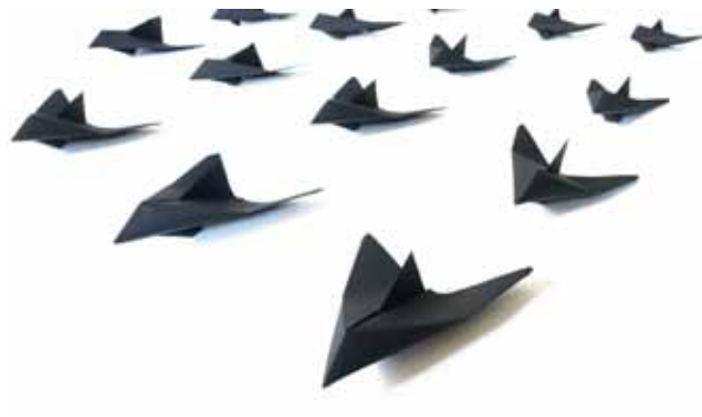
Sašo Sedlaček: Origami Space Race. 2009. installáció © Sašo Sedlaček

Mára ez a mítosz, az elmúlt két évtized politikai változásainak és elképesztő technológiai fejlesztéseinek hatására nemhogy elhalványult volna, hanem a kortárs kultúra egyik mély és igen termékeny táptalajává vált.