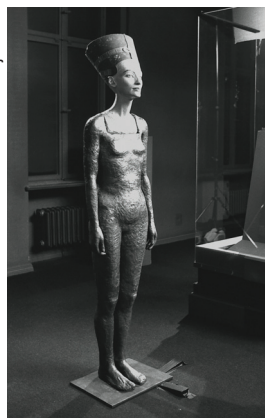
Kis Versé: Megfritti test, 2003, kép a filmből, A művészek jövőléből

Moholy-Nagy László, a modernista művészet kulcsfigurájának rendkívül szerteágazó művészeti és médiateoretikus tevékenységét a fény motívuma köré szervezi ez a kiállítás. 200 festmény, fekete-fehér és színes fotók, filmek és grafikai tervek szerepelnek a válogatásban az 1922 utáni időszakból, amely egybeesik a fotogram műfajának kidolgozásával és a Bauhausban eltöltött évek nagyhatású pedagógiai és művészetelméleti munkásságával.