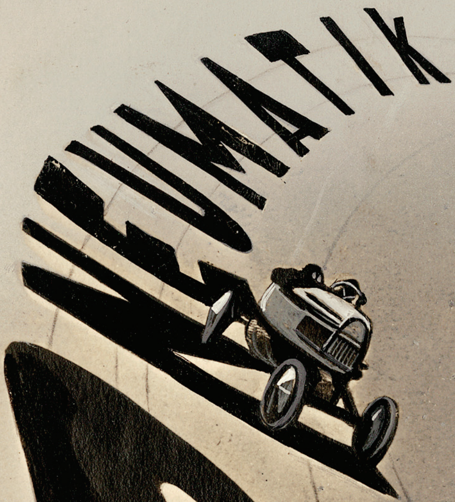
Moholy-Nagy László: Pneumatik, 1924, E. Zjablov, Moscov