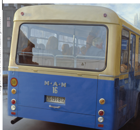
Jadravka Fabur: Bisz Cmrak jele, 1975 A zágrábi Kortárs Művészeti Múzeum jövőléből

A látványos új múzeumépületek, a látogatók megnövekedett száma világszerte jelzi, hogy a múzeumok funkciói az utóbbi évtizedekben átalakultak. A megújult múzeumok nemcsak felbecsülhetetlen értékek őrzői, hanem tömegeket is akarnak oktatni és szórakoztatni. A budapesti Ludwig Múzeum első állandó kiállításának 20. évfordulóján önmagába is néz, amikor a múzeumot, mint intézményt vizsgálja, a hazai és a régióbeli neoavangárd művészet intézménykritikus művein keresztül, valamint kortárs művészek ironikus, szellemes, köztük számos, Magyarországon első ízben látható munkájának bemutatásával.