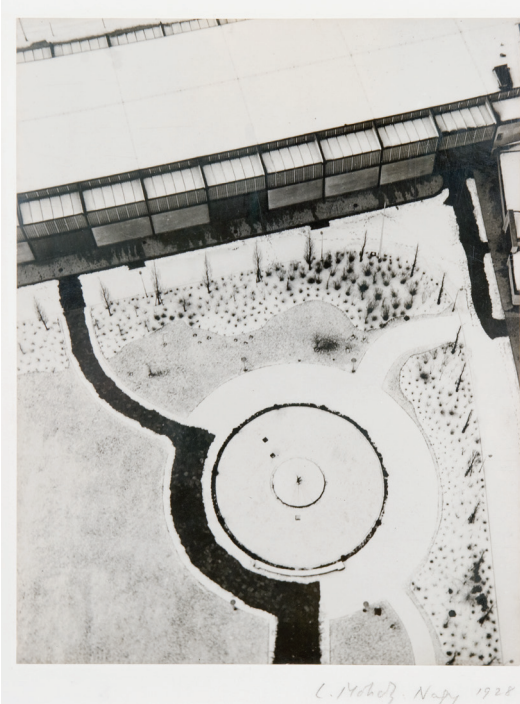
Moholy-Nagy László: Kiállítás a berlini rádiótoronyból, 1928

Mladen Stilnović (1947, Zágráb) a hetvenes években indult közép-európai neoavangárd művészek egyik legjelentősebb képviselője. A Ludwig Múzeum retrospektív kiállítása, mely az első ilyen léptékű tárlata Magyarországon és a régióban, a művész legfontosabb installációit, kollázsait, fényképeit, művészkönyveit és műcsoportjait mutatja be. Stilnović szerteágazó munkásságában az ideológiai jeleket és azok társadalmi vonatkozásait vizsgálja. Művei az ironia, a paradoxon és a manipuláció eszközeivel kritizálják a politikai nyelvhasználatot, a művészet intézményi hierarchiáját, illetve a pénz és a munka szerepét a társadalomban.