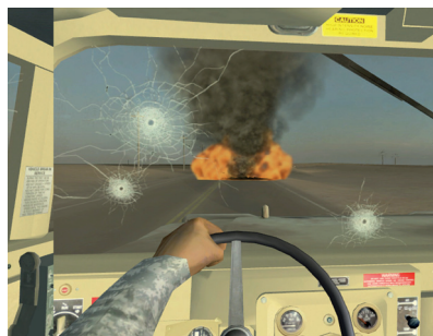
Harun Farocki: Belemérülés, 2009

Rita Ackermann közel húsz éve hagyta el Budapestet, és költözött New Yorkba, ahol hamar ismert figurája lett a kilencvenes évek underground művészeti közegeinek, mely előszeretettel vegyítette a vizuális kultúra valamennyi műfaját a divattól, zenétől vagy az utcai kultúrából nyert inspirációkkal. A kiállítás magja az utóbbi három évben készült, legfrissebb munkákból áll, az életmű egészéből referenciapontként választva kulcsmunkákat, melyek mentén művészi pályája megrajzolható.