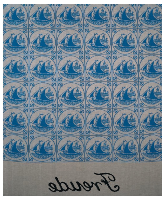
Rosemarie Trockel: Öröm • Joy, 1988 Az aacheni Peter und Irene Ludwig Stiftung letéje • Long-term loan from the Peter und Irene Ludwig Stiftung, Aachen

Where have all the heroes gone? Where are the heroes that we came to know so well from the 19th-century novels? The heroes of romantic narratives, who persevere and even triumph under dire circumstances and in the midst of tribulations. They may (as well) be the soldiers of Pete Seeger's lyrics from the early 1960s, who end their heroic lives in the graveyard. The word 'hero' is outdated; even when discussing literature, we tend to speak of characters instead of heroes. In this regard, one may be