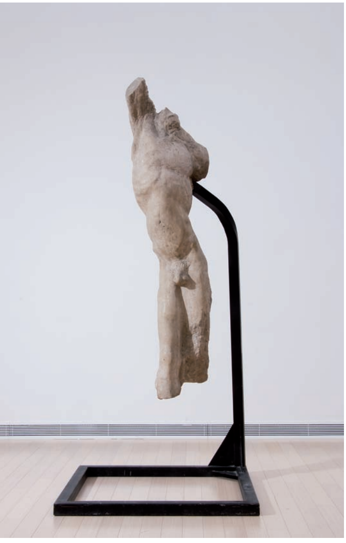
Alfred Hrdlicka: Férfi torzó • Male Torso, 1954–1962 Az aacheni Peter und Irene Ludwig Stiftung letéje • Long-term loan from the Peter und Irene Ludwig Stiftung, Aachen

Kurátor • Curated by TIMÁR Katalin Kutatás • Research assistants BARKÓCZI Flóra, ÜVEGES Krisztina Kiállítás design • Exhibition design KORONCZI Endre Külön köszönet • Special thanks to SZÜCS Tibor és a Dekorátor Iskola, Budapest