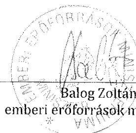
Balog Zoltán emberi erőforrások minisztere