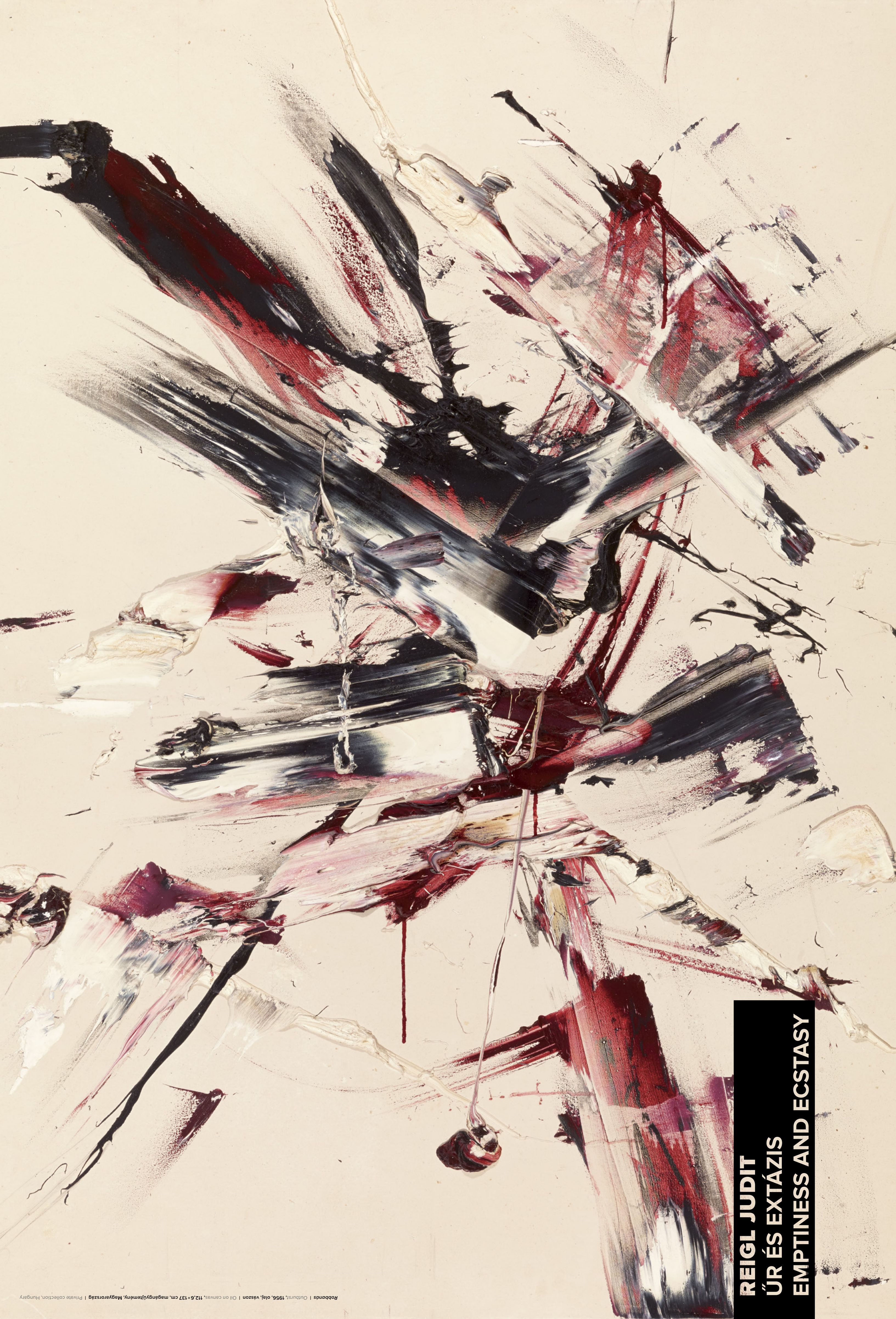
REIGL JUDIT ŰR ÉS EXTÁZIS EMPTINESS AND ECSTASY