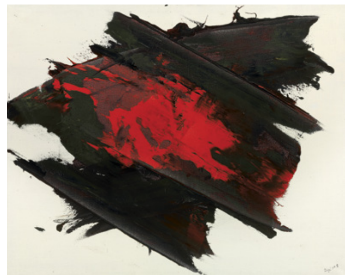
Tömbírás | Mass Writing , 1958 olaj, vászon | Oil on canvas, 74 × 94 cm magángyűjtemény, Magyarország | Private collection, Hungary