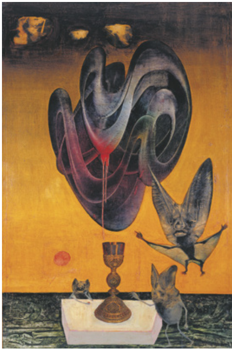
Hasonlíthatatlan gyönyör | Incomparable Pleasure , 1952–53 olaj, kollázs, vászon | Oil, collage on canvas, 134 × 88 cm magángyűjtemény, Magyarország | Private collection, Hungary

Leginkább az a történet ragadhatja meg a látogatót, amikor 1950-ben Reigl Judit többszöri próbálkozás után végre átjutott a vasfűgönyön, és több hónapos utazás után megérkezett Franciaországba. 1954-ben a szintén Párizsban élő művész-társa, Hantai Simon bemutatta őt André Bretonnak, a szurrealizmus atyjának, aki azon nyomban meghívta egy kiállításra a szurrealisták galériájába, a L'Étoile scellée -be. Reigl Judit először visszautasította, majd pár hónapra rá elfogadta a meghívást. A szurrealisták vizuális programja azonban túl szűknek bizonyult a festő számára. Igyekezett kitörni az előírt, kizárólagosan figuratív kifejezési módból. Ebben található valójában Reigl Judit életművének lényege. Az illusztratív kereteket korán szétrobotntva automatikus, gesztuális, absztrakt, írásszerű