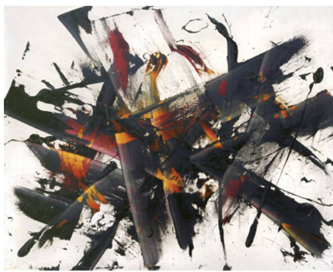
Robbanás | Outburst , 1956 olaj, vászon | Oil on canvas, 90 × 114 cm magángyűjtemény, Magyarország | Private collection, Hungary

Reigl Judit festészetében 1966-ban tér vissza először a figura, ami egyben egy újabb ciklus nyitányát jelzi. Az Homme ( Ember , 1966–72) című sorozatban monumentális fehér vagy fekete alapon sárga, piros és kék, függőlegesen ábrázolt lebegő