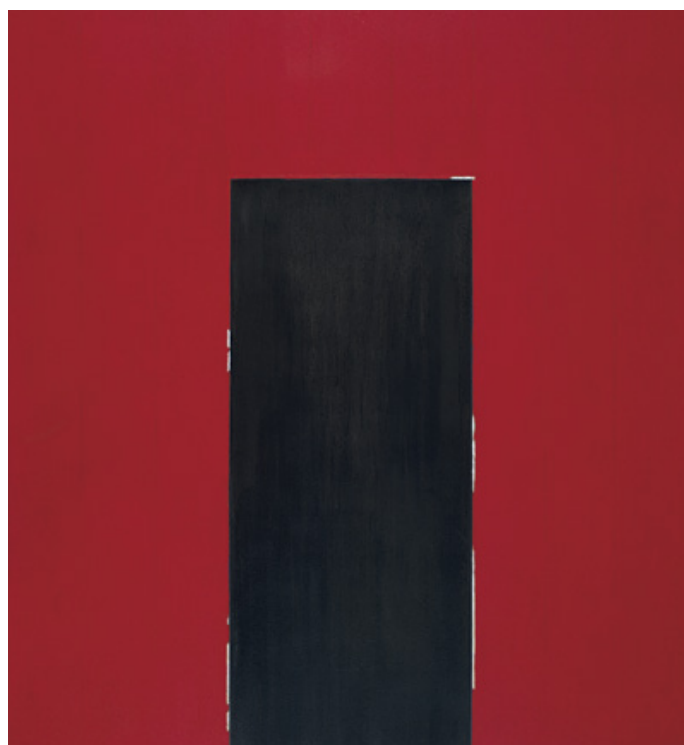
Bejárat-Kijárat | Entrance-Exit , 1988 vegyes technika, vászon | Mixed media on canvas, 220 × 195 cm a művész tulajdona | Property of the artist

The exhibition is curated by: Kálmán Maklár and Róna Kopeczky.