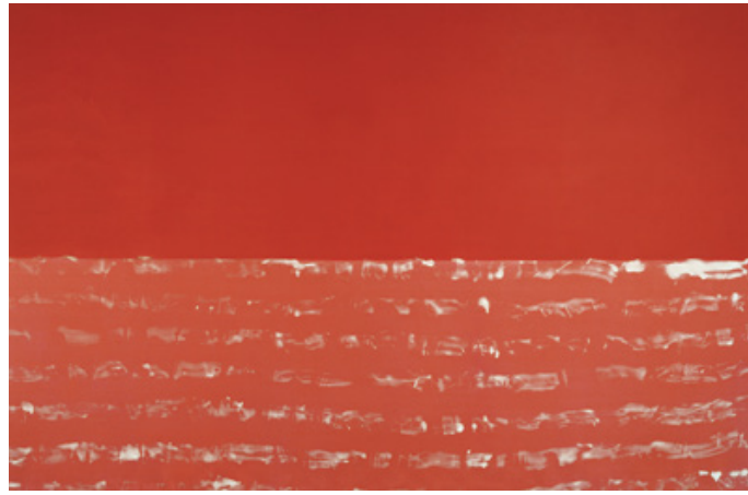
Folyamat | Unfolding , 1974 vegyes technika, vászon | Mixed media, canvas, 195 × 300 cm magángyűjtemény, Franciaország | Private collection, France