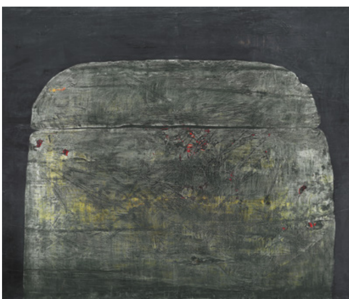
Guano | Guano , 1959–63 vegyes technika, vászon | Mixed media, canvas, 212 × 270 cm magángyűjtemény, Magyarország | Private collection, Hungary

The story could captivate the viewer most, when in 1950 Judit Reigl, after multiple attempts, finally crossed the Iron Curtain and, after a journey of several months, arrived in France. In 1954, her artist colleague also living in Paris, Simon Hantai, introduced her to André Breton, the father of Surrealism, who then invited her for an exhibition at the gallery of the Surrealists, the L'Étoile scellée . At first, Judit Reigl declined, but then accepted the invitation after a couple of months. The visual programme of the Surrealists, however, proved to be too narrow for the painter. She tried to break out from the prescribed, exclusively figurative mode of expression. And in this is the true essence of Judit Reigl's life oeuvre. She burst out of the illustrative framework early on, and began experimenting with automatic, gestural, abstract symbols that resembled writing, already in 1952. Her breakthrough from figurativity simultaneously meant a step beyond Surrealism for the artist. Beyond these formal questions, contrary to the Surrealists, Judit Reigl regards the painting not only as an unconscious imprint of the psyche, but also as a surface that receives corporeal energies