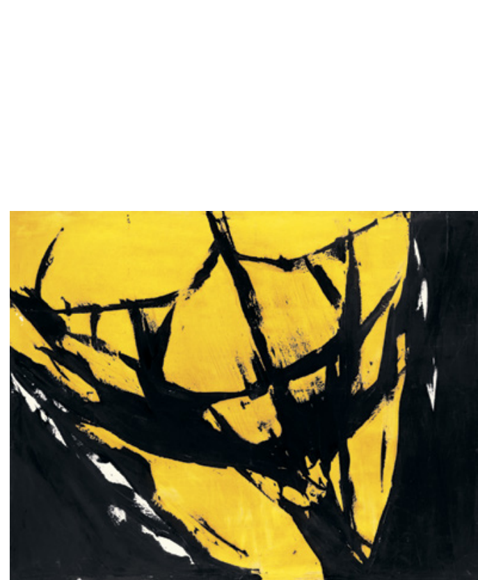
Ember | Man , 1969–70 olaj, vászon | Oil on canvas, 207 × 270 cm magángyűjtemény, Franciaország | Private collection, France