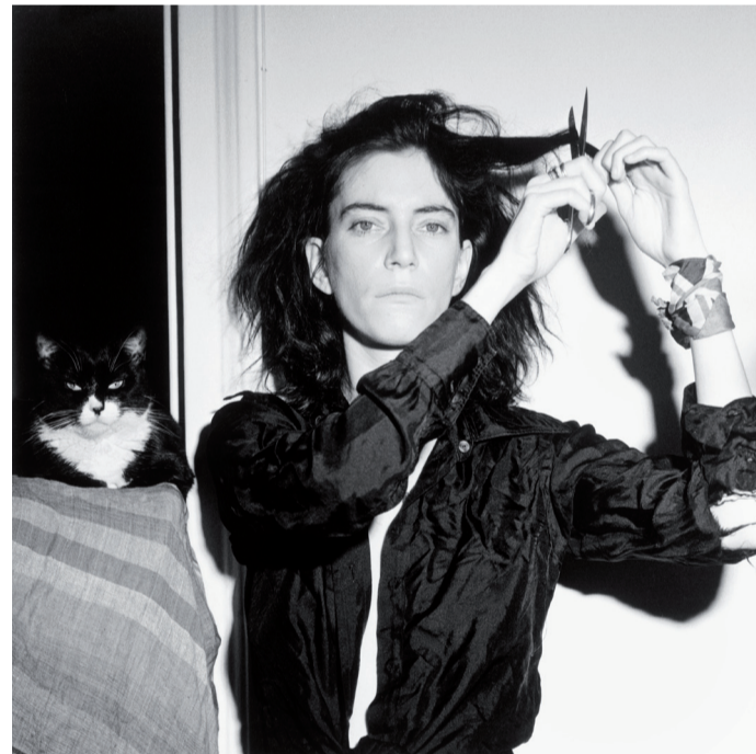
Robert Mapplethorpe: Patti Smith , 1978

Initially, Mapplethorpe had no intention of becoming a photographer. His early collages and altar-like installations incorporated found elements including photos from magazines. Seeking to give these works a more telling and perfect touch, he decided to shoot the photos himself. His major subjects were his immediate environment and personal desires: the alternative circles of the New York art scene, his identity as a homosexual, non-traditional forms of sexuality, and the communities organised around them. The New York