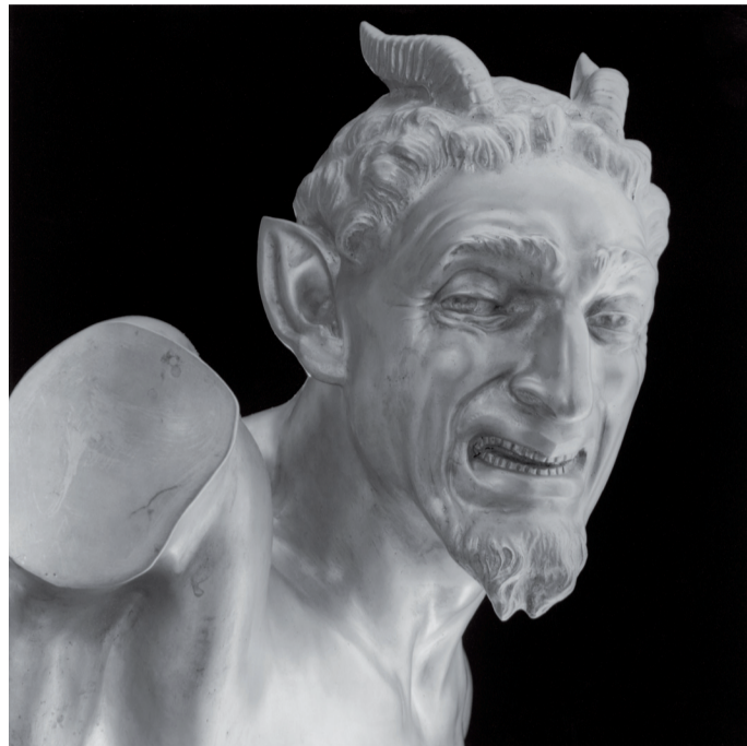
Robert Mapplethorpe: Italian Devil | Olasz ördög, 1988

A budapesti Ludwig Múzeum kiállítása Robert Mapplethorpe közel kétszáz munkáját mutatja be, korai polaroid képeitől az utolsó évekig. A Magyarországon első alkalommal látható, nagy-szabású tárlat a New York-i Robert Mapplethorpe Foundation-nel együttműködésben született.