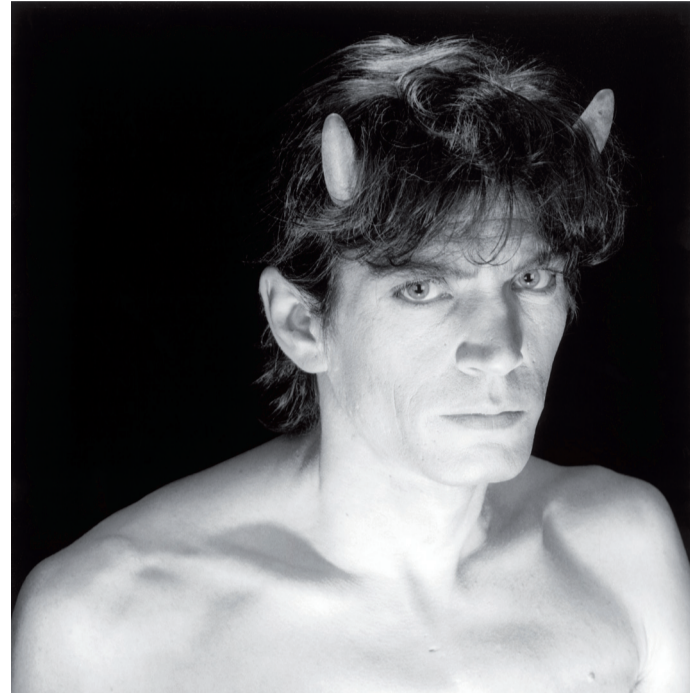
Robert Mapplethorpe: Self Portrait | Önarckép, 1985

Mapplethorpe nem készült fotográfusnak. Korai kollázsaihoz és talált elemeket felhasználó oltárszerű installációihoz magazinfotókat használt, ezek célzottabbá és tökéletesebbé tételéhez kezdett el maga is fényképezni. Közvetlen környezete és személyes vágyai, a New York-i alternatív körök, saját homoszexuális identitása, a szexualitás nem hagyományos formái, s az ekörül szerveződő kö-