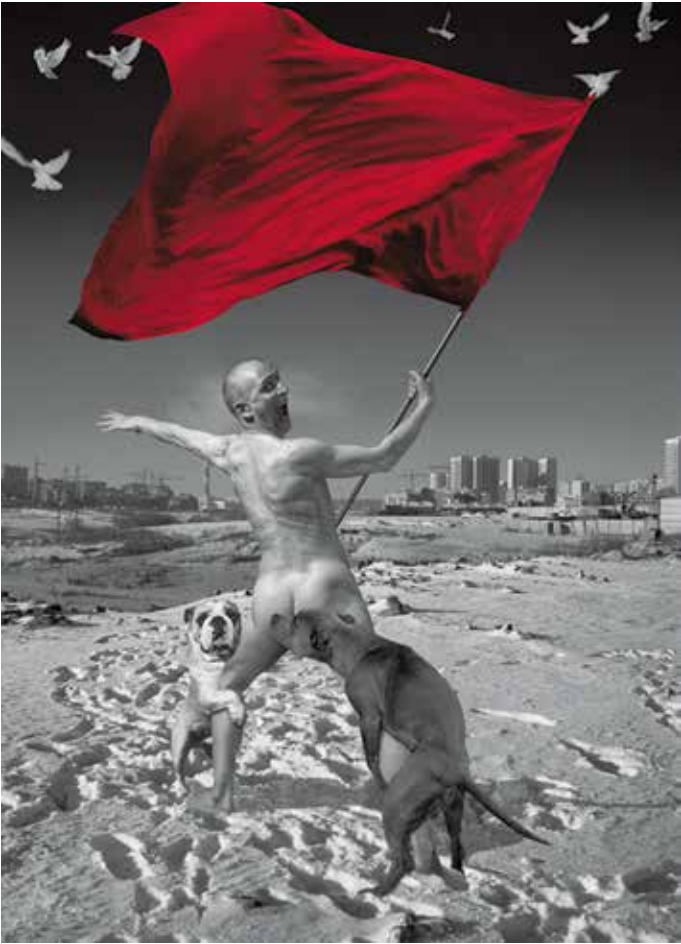
OLEG KULIK: Eclipse 1 (Ember vörös zászlóval) | Eclipse 1 (Man with A Red Flag), nyomat Az Orosz c. projektből | print from The „Russian” project, 1999–2000