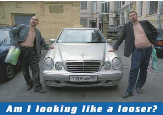
BLUE NOSES: Úgy nézek ki, mint egy lósz? | Am I Looking Like a Loser?, 2001, nyomat | print, 1000x860 mm

Jóllehet különböző kulturális és művészeti, sőt, bizonyos mértékig különböző politikai kontextushoz tartoznak, Josip Vaništa és Oleg Kulik munkáinak közös nevezője a tranzícióra , a durva időkre, az ellenőrizetlen privatizációra