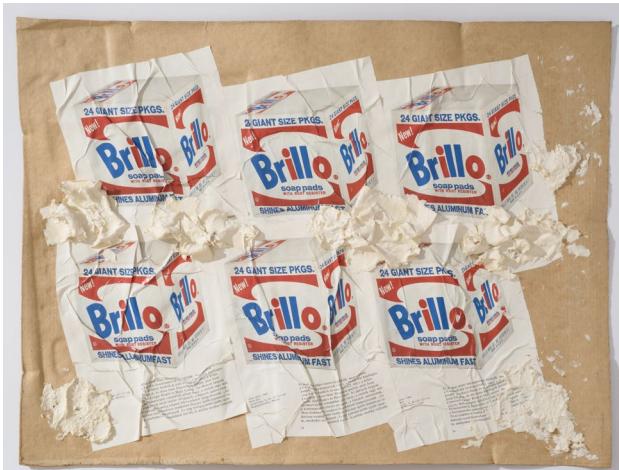
LENGYEL András: Andy Warhol Recycled, 1998–99 merített papír, papírmassza, (Andy Warhol-katalógus újrahasznosítás) / dipped paper, paper pulp, (Andy Warhol catalogues recycled); magántulajdon / private property