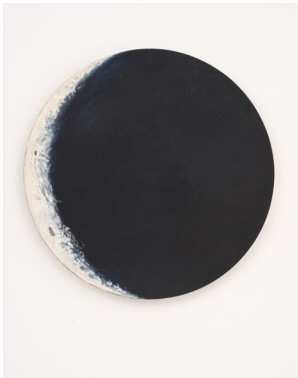
LENGYEL András: Hold / Moon, 1997 olaj, vászon / oil on canvas; magántulajdon / private property