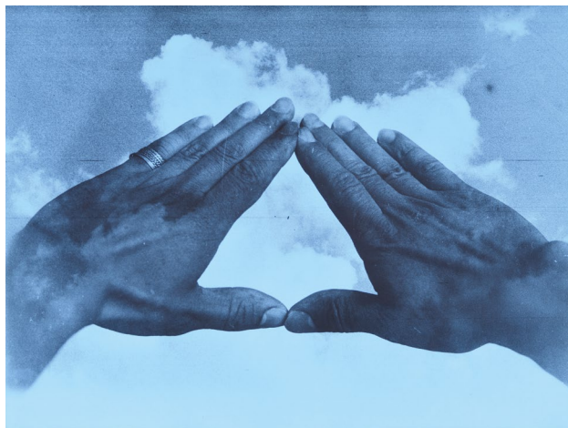
LENGYEL András: Nyílt tér I. / Open Space I, 1979 manipulált fotogram / manipulated photogram; magántulajdon / private property; Fotó / Photo: ROSTA József

A kiállításához kapcsolódó programok különleges élményekkel várják az érdeklődőket. A részletek a múzeum honlapján találhatóak: www.ludwigmuseum.hu