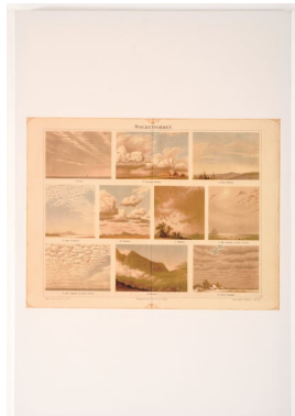
LENGYEL András: Felhő-lexikon / Cloud Lexicon, 2003–2004 olaj, vászon / oil on canvas; ma- gántulajdon / private property; Fotó / Photo: ROSTA József