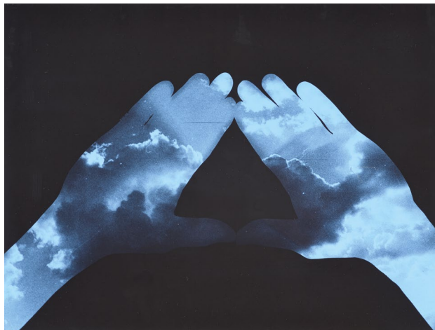
LENGYEL András: Nyílt tér II. / Open Space II, 1979 manipulált fotogram / manipulated photogram; magántulajdon / private property; Fotó / Photo: ROSTA József

The programmes related to the exhibition will be offering special events for all those interested. Details can be found on the museum's website: www.ludwigmuseum.hu