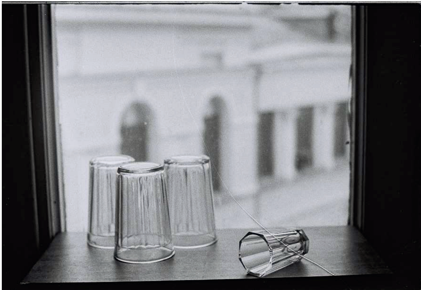
Anna DAUČÍKOVÁ: Családi Album / Family Album, 1998/2017 Ludwig Múzeum – Kortárs Művészeti Múzeum / Ludwig Museum – Museum of Contemporary Art