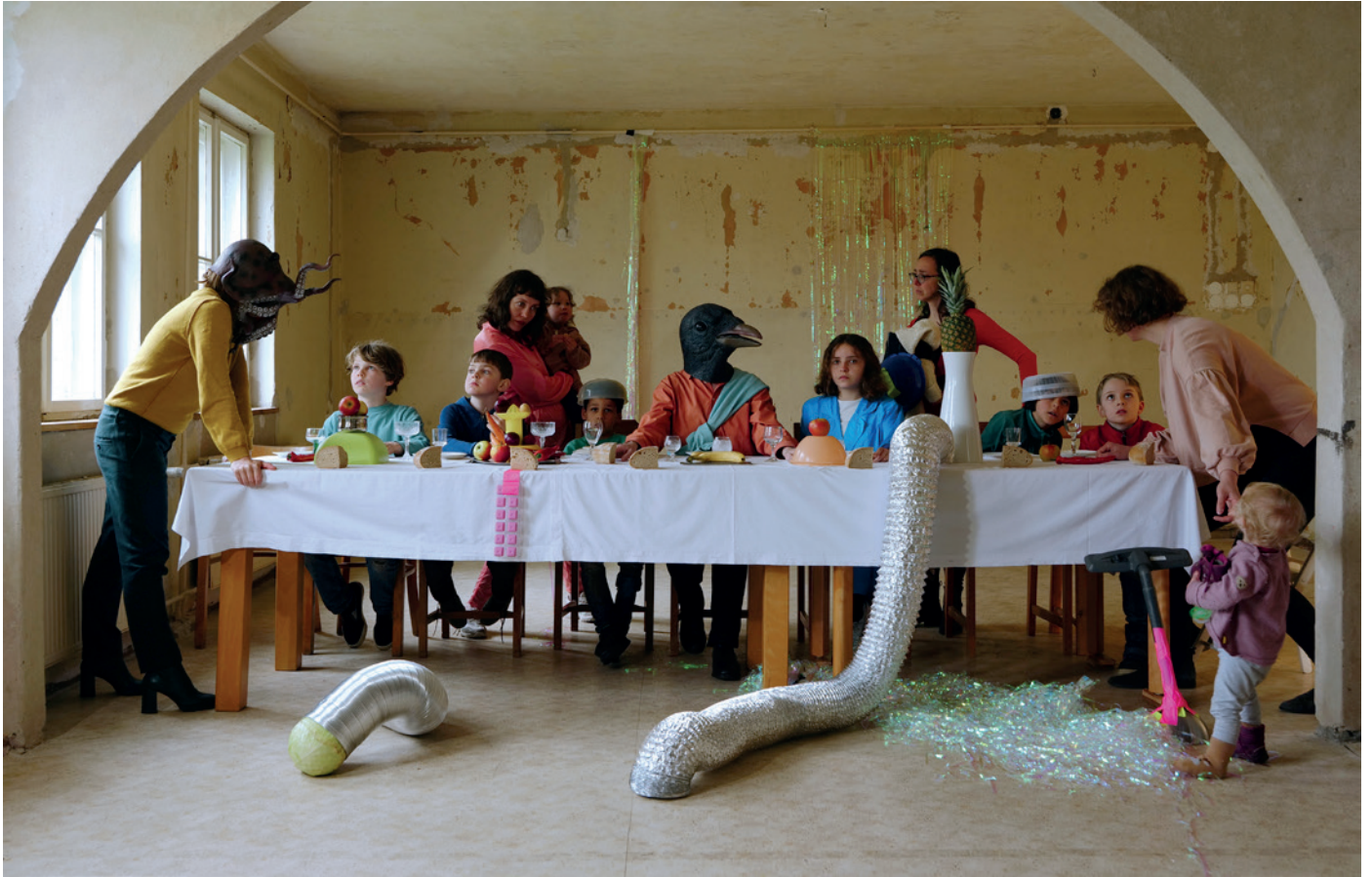
MATERNAL FANTASIES: A legelő vacsora / The First Supper, 2023