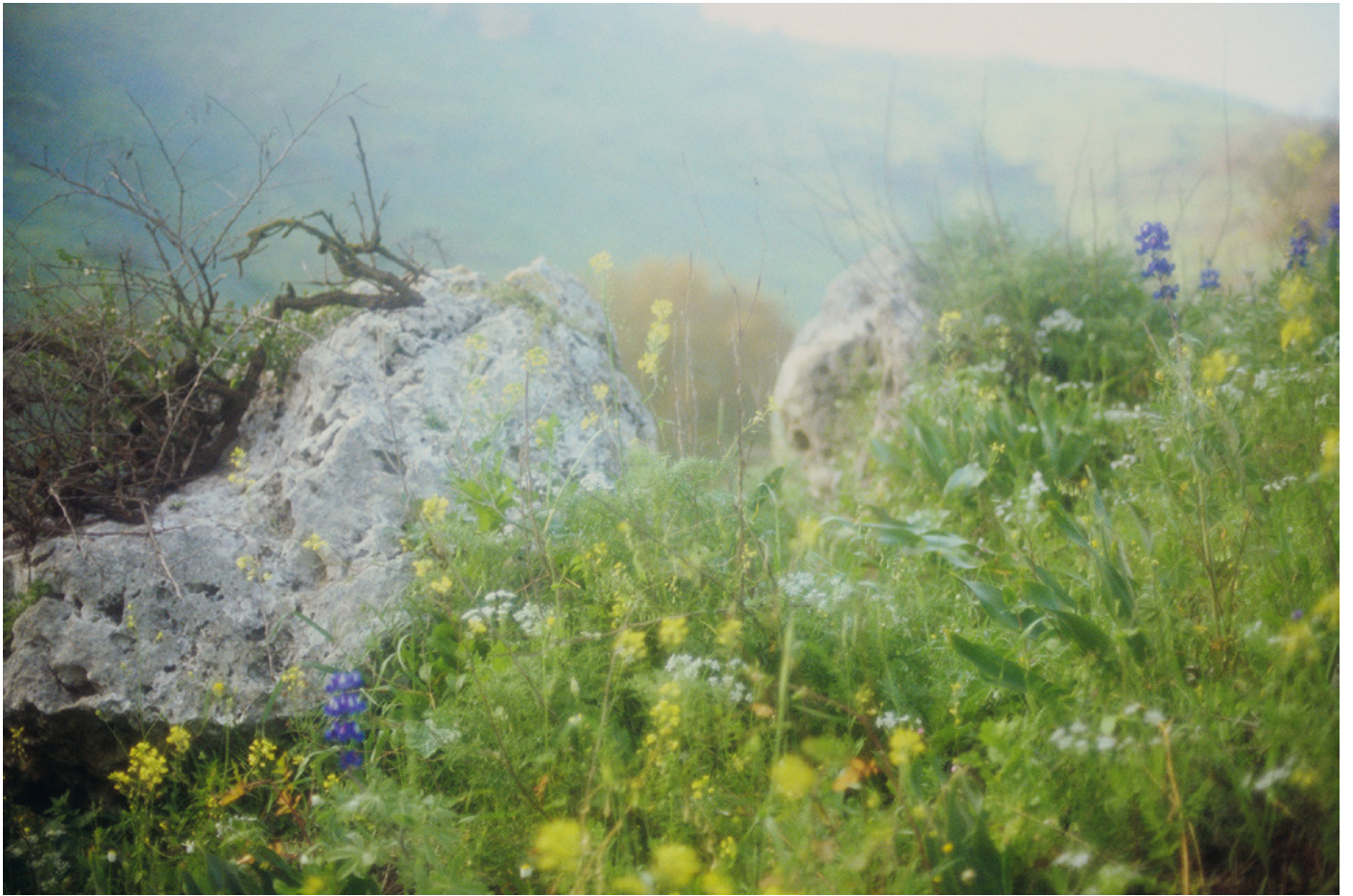
Nocte Decus, 2016