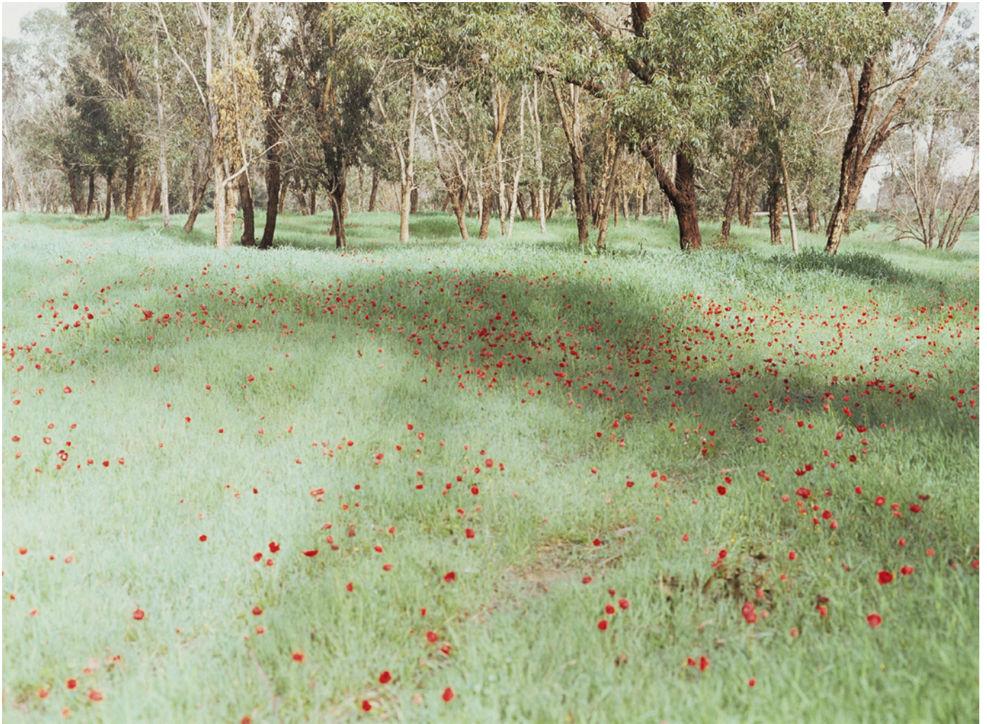
Somnum Rubrum, 2012 180 × 244 cm, Chromogenic