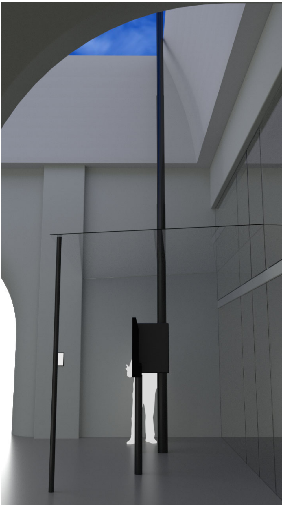
Az interaktív installáció az átrium bal oldalán (Számítógépes szimuláció)