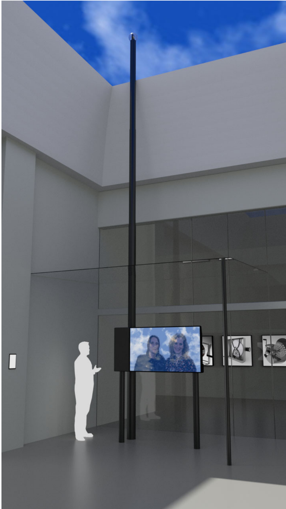
Az interaktív installáció az átrium bal oldalán (Számítógépes szimuláció)