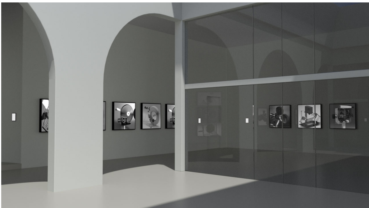
A kiállítás képe az átriumból (Számítógépes szimuláció)