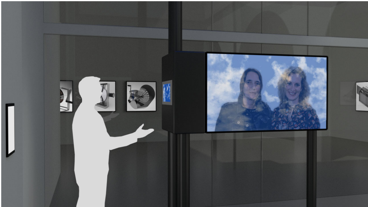
Az installáció az átrium felől nézve (Számítógépes szimuláció)