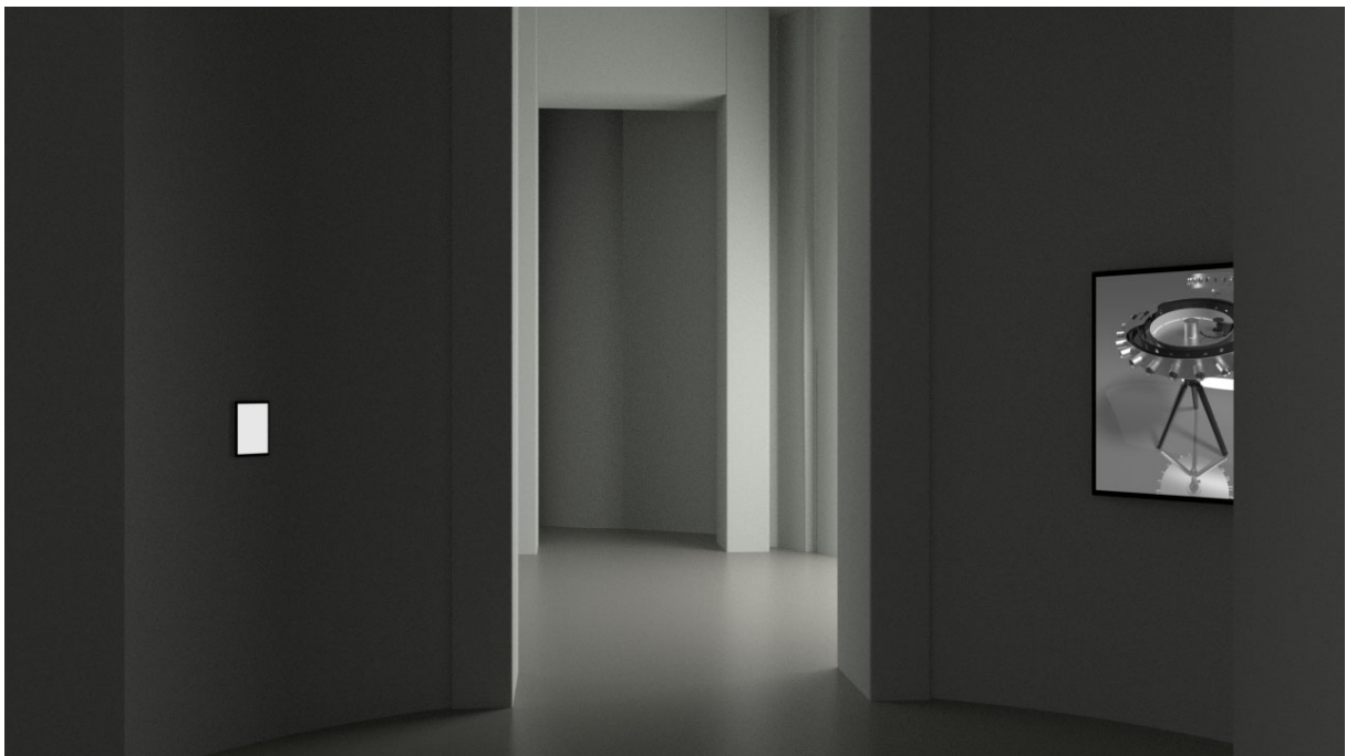
A kiállítás képe a bejárat irányába nézve (Számítógépes szimuláció)