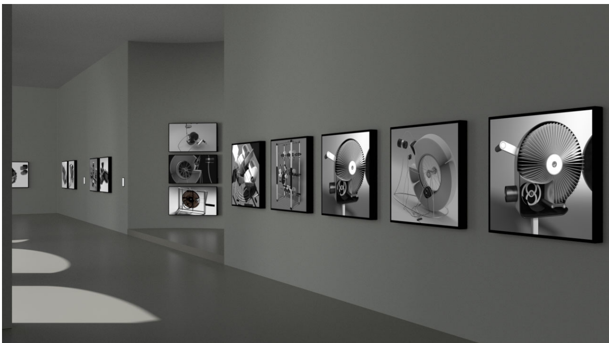
A kiállítás képe a hátsó fedett térben (Számítógépes szimuláció)