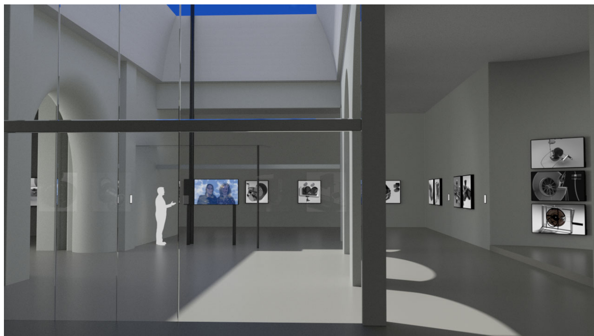
A kiállítás képe a jobb oldali fedett térből (Számítógépes szimuláció)

angol, felsőfokú nyelvvizsga francia, középfokú nyelvvizsga