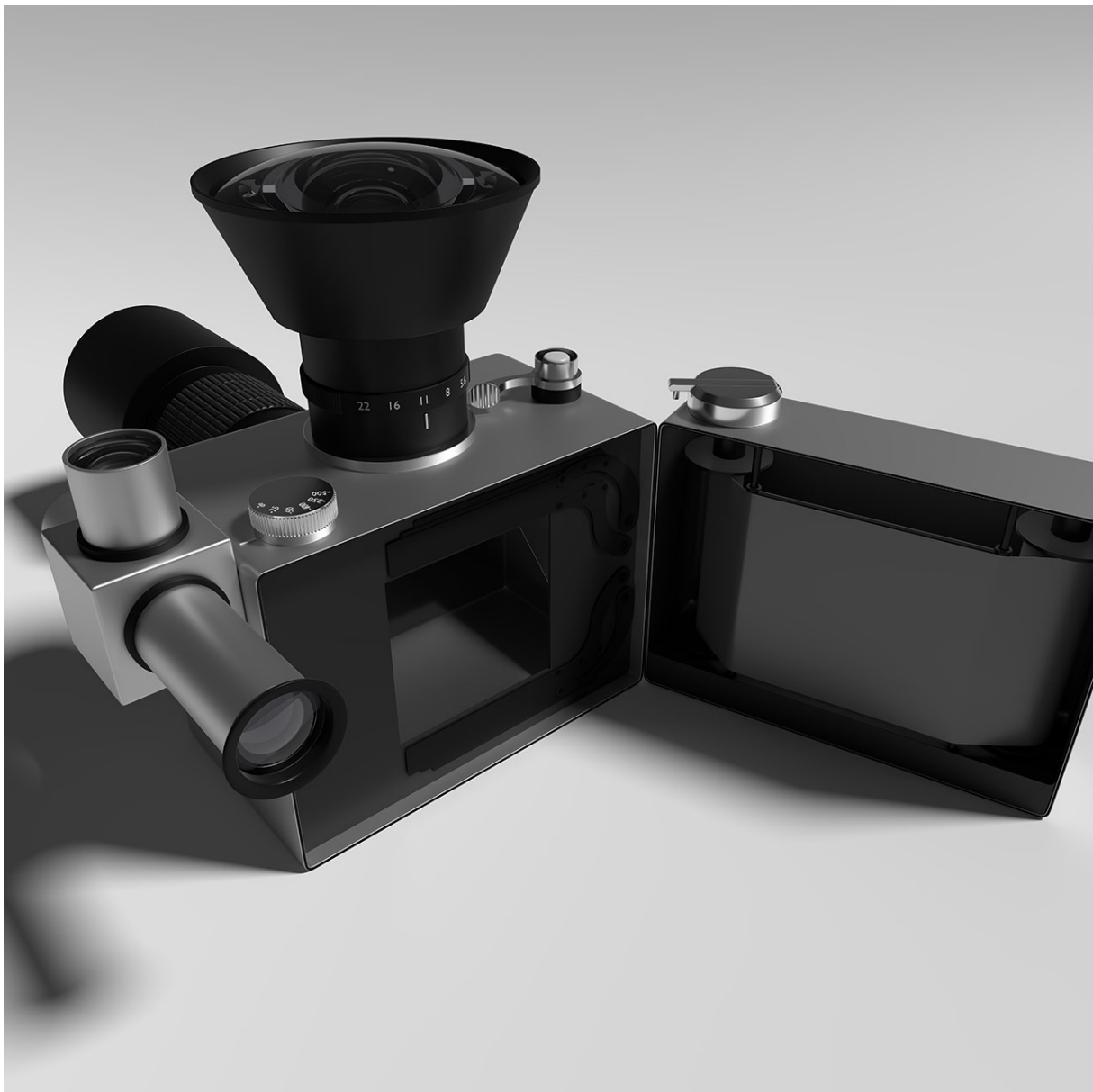
Waliczky Tamás: Fénymegosztós Kamera / Beam Splitter Camera, 2017

19. században a fénykép készítéskor sokszor a használó érzésére, tapasztalatára kellett hagyatkozni például az expozíciós idő meghatározásában, itt is hasonlóan fontos elem a kiszámíthatatlanság. A véletlen szerepe, pontosabban a véletlen szerephez juttatása, a helyben komponálás és a javító utómunkálatok minimalizálása az, ami kevésbé jellemző a mai kor világhoz való viszonyára, amikor mindennek utána lehet nézni, „le lehet kontrollálni”. Ezzel szintén a fotótörténet korábbi időszakaira vezet vissza, amikor az esetlegesség sokkal nagyobb mértékben beleszólt a felvétel milyenségébe. Itt az újmédia művész digitális technológiával szimulálja az analóg képalkotás esetlegességeit. A látogató ezt maga is megtapasztalhatja a központi installációként megépített Fénymegosztós kamera/Beam Splitter Camera révén. E két lencsés kamera egyik objektívje a kiállítás látogatóiról készít portrét, míg a másik, többméteres vertikálisan felállított rúd tetején található objektív a velencei égről készít felvételt. Produktumaiban az egyéniség leképezésében az utazó szelfiző turista gyakorlata keveredik a tájháttérrel kiegészített portré – festészeti és fotóművészeti – hagyományával.