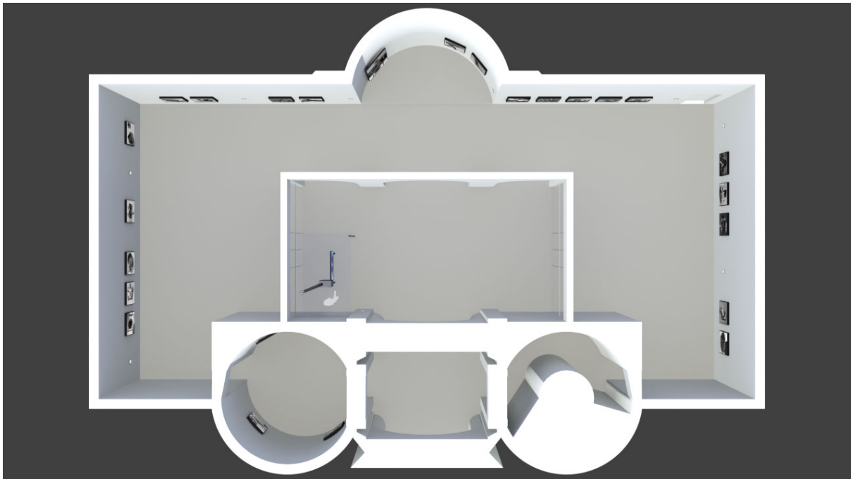
A kiállítás sematikus képe felülről nézve (Számítógépes szimuláció)

nagyfelbontású grafikát 1x1 m nagyságú lightboxokon mutat be, ezek közül öt kamerát több oldalról bemutató, megmozgatott ábrázolások kb. másfél perces loopolt animációk tv monitorokon jelennek meg. A kamerák által készíthető felvételek szimulációi révén a látogatók teljes képet kapnak a kamerák mechanikáiról, végül az átriumban az egyik fantázia kamera megépített, digitális változatán maga is kipróbálhatja a Fénymegosztós kamera működését. A művész a kamerákat mutató lightboxokat, és az animációkat lejátszó monitorokat szerkezeteik vizuális vagy technikai hasonlósága alapján csoportokban rendezi el, minden egyes csoporthoz egy-egy tablet révén további információkhoz juthatunk a kamerák mechanikáiról.