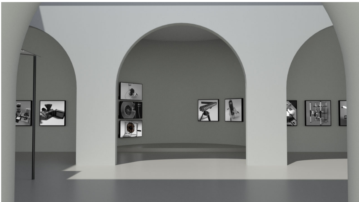
A kiállítás képe a bejárat felől (Számítógépes szimuláció)