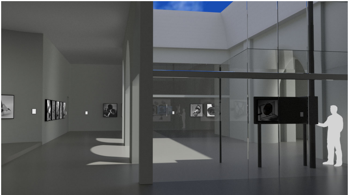
A kiállítás a bal oldali fedett tér felől nézve (Számítógépes szimuláció)