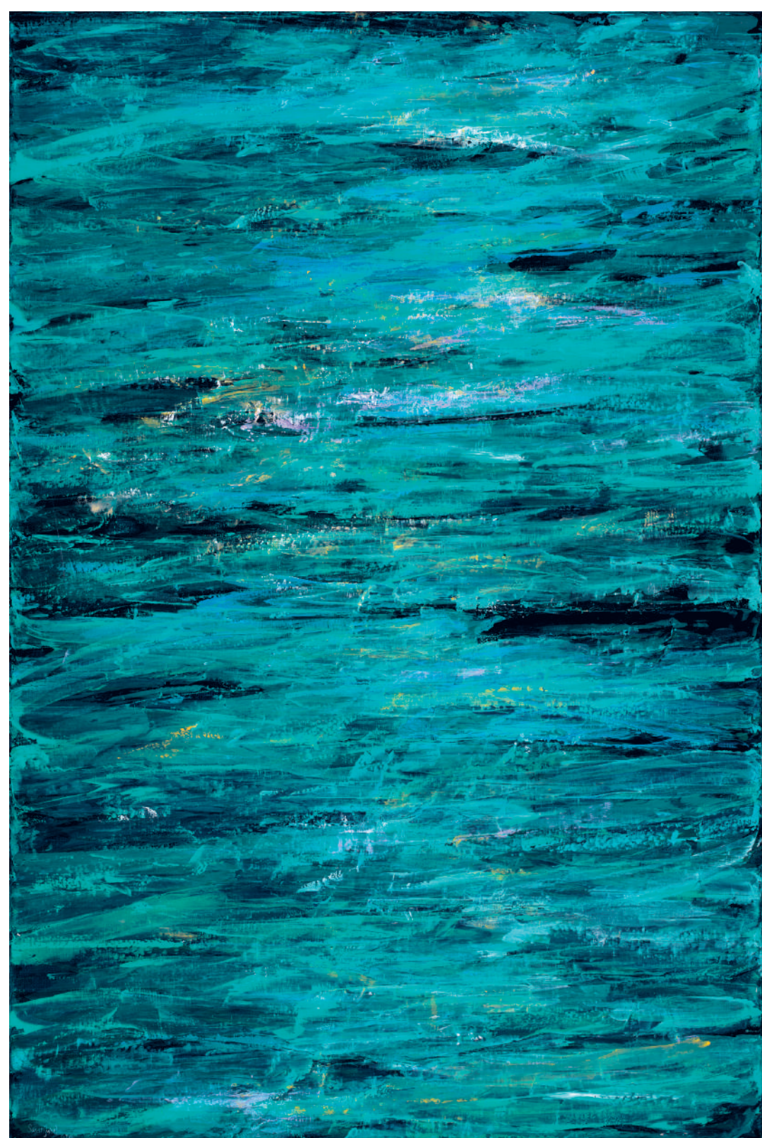
Susan Swartz: Együlthangzó táj 009. | Landscape of Resonances 009, 2013, 183 × 122 cm | jövőtábol

SUSAN SWARTZ SZEMÉLYES UTAK PERSONAL PATH