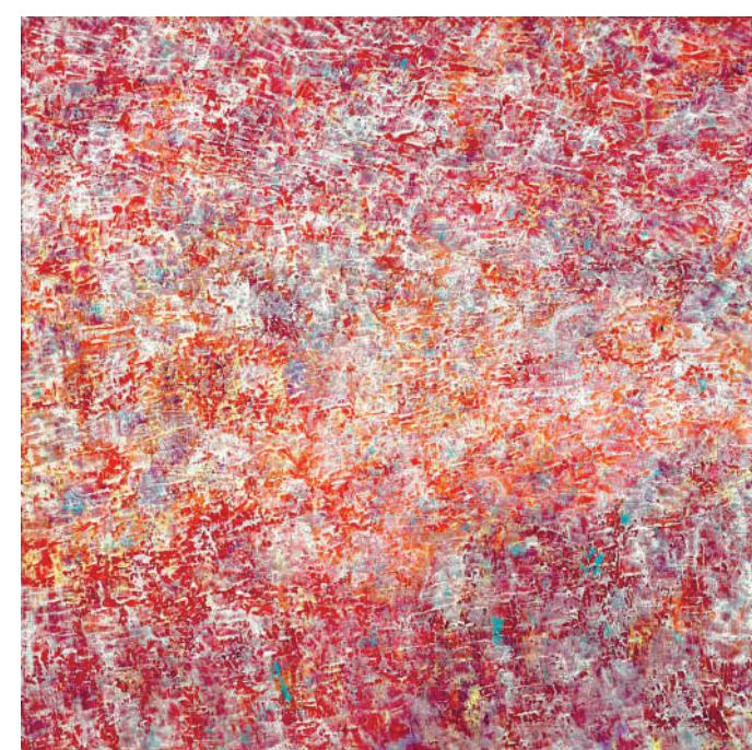
Susan Swartz: Pislakoló fény | Shimmering Light, 2016, 122 × 122 cm, © Courtesy of Susan Swartz Studio | jövőtábol

Susan Swartz's Personal Path is a cooperation with the Foundation for Art and Culture in Bonn (www.stiftungkunst.de).