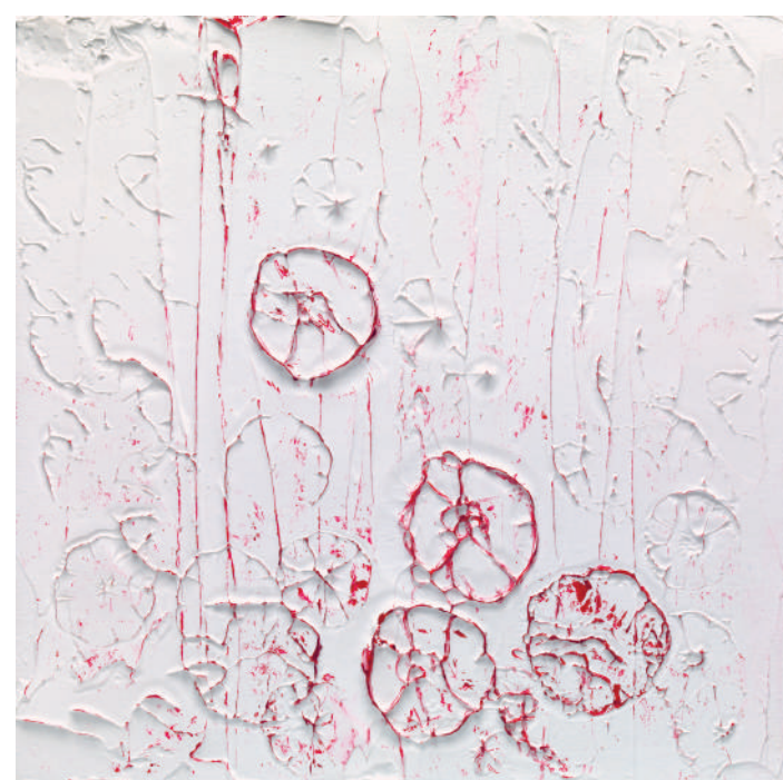
Susan Swartz: Újra a természetben 1. | Nature Revisited 1, 2016, 31 × 31 cm, © Courtesy of Susan Swartz Studio | jövőtábol

Susan Swartz Személyes utak c. kiállítása a bonni Stiftung für Kunst und Kultur (www.stiftungkunst.de) alapítvánnyal együttműködésben jött létre.