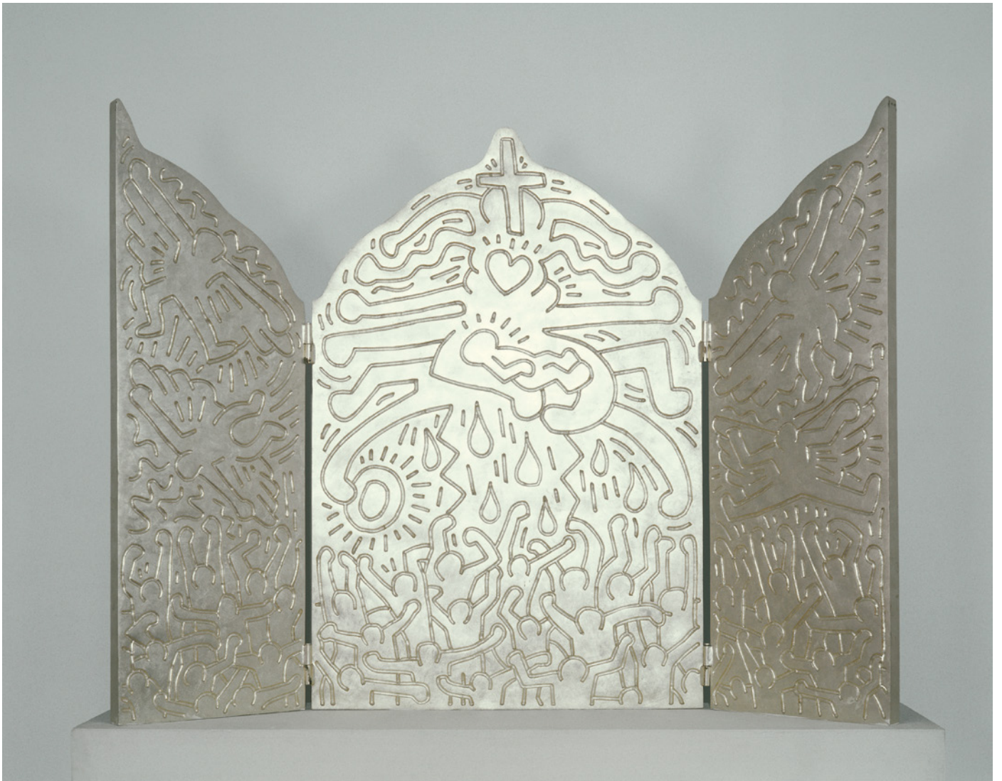
Keith Haring: Szárnyasoltár, 1990