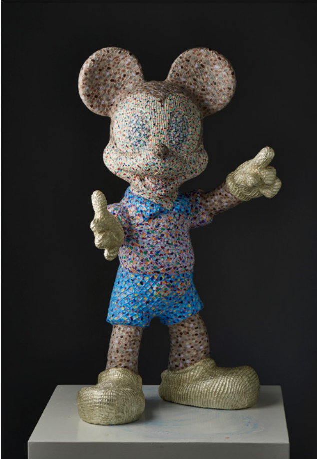
Sam Havadtoy: Mickey , 2013 talált tárgy, antik csipke, akril, fehér arany / Artist's Name: Work Title , mixed media, lace, acrylic paint and gold leaf on found object 84 × 47 × 32 cm

in many ways to chess, as one attempts to figure out the moves of the other player in advance. "To my mind, chess has become a metaphor of love," he claims. Bobby Fischer's 41-move match against Boris Spassky in 1972 thus received a 41-part series of paintings in which every move is captured in a particular shade of white. The three games of chess per day with Yoko Ono and the games of their relationship are thus mirrored in the screen-printed collage series covered with lace.