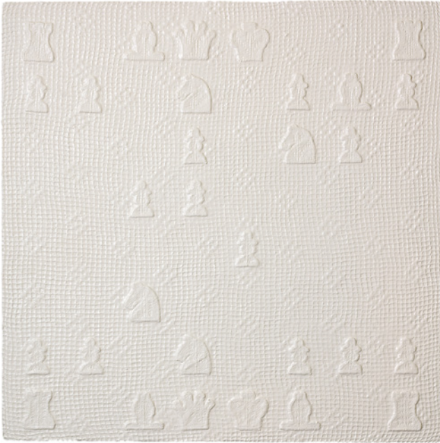
Sam Havadtoy: A Játék, 2006 antik csipke, akril, vegyes technika / Sam Havadtoy: The Game, 2006 mixed media, lace, acrylic paint 101 × 101 cm

own interpretation of the Modiglianis, he mentions Elmyr de Hory, the painter of Hungarian descent who forged the two Modigliani portraits, as a counterpoint compared to which he “restores” the genuine nature of the portraits, as if creating or recreating new works of art. The gestures of recreation, obfuscation or partially covering up works are nothing new in the history of art and play a significant critical role in modern art. In the case of Havadtoy, apart from the play with delineation, the decorative value of the items – his approach as a decorator or interior designer – also plays a significant role (e.g. the series based on the tones of the Pantone range). His works often seem to cover up or reposition themselves.