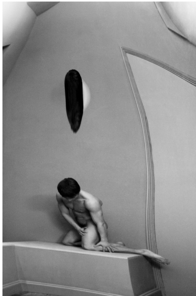
Sam Havadtoy: Torzítások 16. zselatinos ezüst / Sam Havadtoy: Distorsions 16. gelatin silver print 40 × 26,5 cm