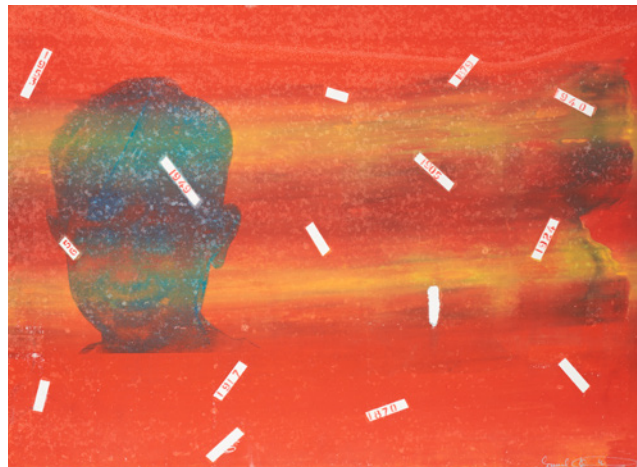
Sam Havadtoy: Józsi vegyes technika, szitanyomat, vászon / Sam Havadtoy: Self portrait, 1985 mixed media, silkscreen on canvas 60 × 83 cm