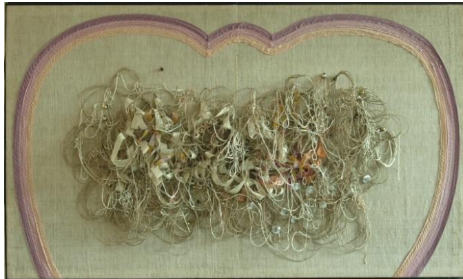
2. ábra: Keszérü Ilona Gubanc című műve a restaurálás előtt és után (KOVÁCSNÉ 2015)