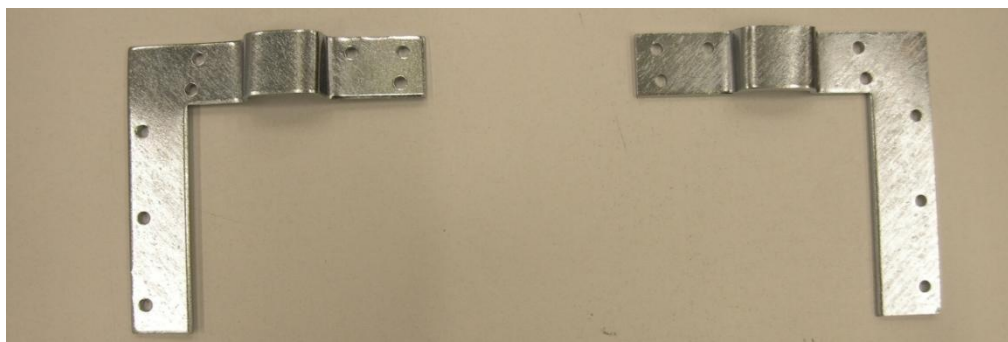
5. ábra: Új, nagy teherbírású képakasztó sarokvas pár (KOVÁCSNÉ 2015)

Az elavult képakasztók cseréje, - mely érinti a restaurálásra kerülő tárgyakat, illetve a kiállításokra kölcsönzött műveket - műtárgyvédelmi szempontból jelentős, valamint az installálás és raktározás során is elengedhetetlen a műtárgyak stabil rögzítése.