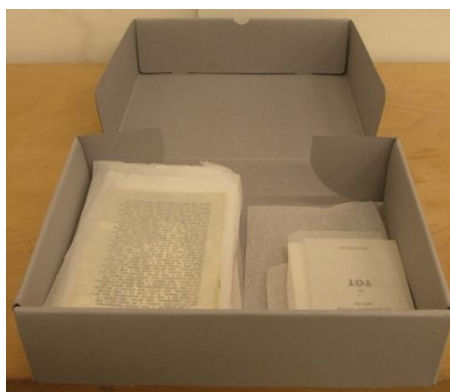
6. ábra: Tót Endre művészkönyvei előkészítve művészettörténeti kutatáshoz (KOVÁCSNÉ 2015)