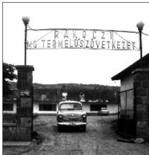
Az abasári Rákóczi MgTsz kapuja az 1960-as években.

Jelentős változást mutat a fiatalok gondolkodása. Erősödik a törekvés a kulturáltabb életkörülményekre és ennek feltételeként a több szabad időre. (Ezzel összefügg például a háztáji állattartás vártnál gyorsabb csökkenése.) Kedvező változás tapasztalható a fiatalok eszmei-politikai felfogásában is. Erről tanúskodik az ifjúsági parlamentek aktivitása és nem utolsósorban az