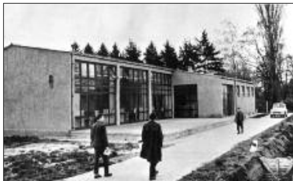
A barcsi Vörös Csillag tszcs-ben modern üzemi konyhát és éttermet adtak át rendeltetésének.

A régebbi falusi osztálytagozódás gazdasági alapjai lényegében megszűntek. Léteznek a mai fa-