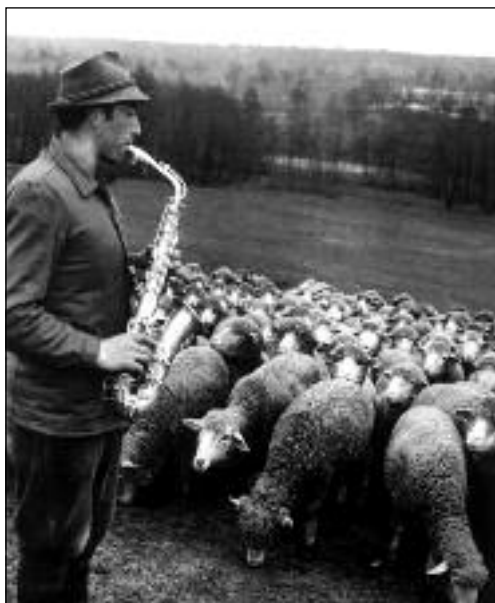
Az városzlódi Állami Gazdaság juhásza nagyon kedveli a szaxofont és úgy látszik, a juhok is szívesen hallgatják a hagyományos furulyaszó helyett.

zeti mozgalom győzelmével az egész népgazdaságban uralkodóvá váltak a szocialista termelési viszonyok, befejeztük a szocializmus alapjainak lerakását. Sikeresen oldottuk meg a szocialista átszervezés és a termelés növelésének kettős feladatát. Létrejötték a mezőgazdaság szocialista fejlődésének, a falu, a parasztság anyagi és szellemi felemelkedésének elengedhetetlen feltételei. Meggyorsult a termelőerők fejlődése, átalakult a társadalom osztályszerkezete. Új tartalmat kapott, megszilárdult rendszerünk legfőbb politikai alapja, a munkásosztály és a parasztság szövetsége, erősödött a szocialista nemzeti egy-