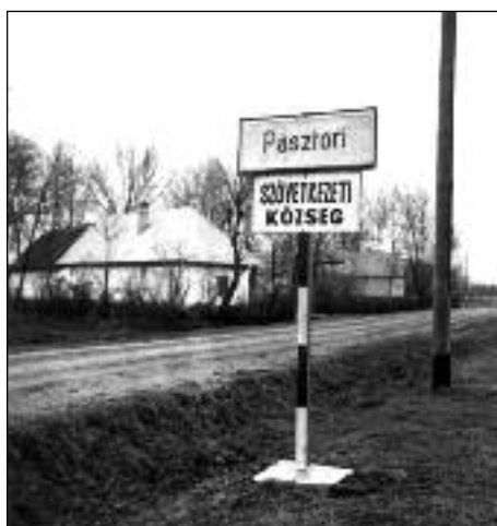
Pásztori község táblája. Rózsa László felvétele, 1965. Magyar Nemzeti Múzeum

A termelőség-szövetkezeti parasztság a jövő egysé-ges szocialista parasztosztályának magját képezi. Gazdálkodási módja elvileg és alapjaiban kü-lönbözik az egyénileg gazdálkodókéttól. A mező-gazdasági termelés és a paraszti életforma új perspektíváját tárja fel a dolgozó parasztság kü-lönböző rétegei előtt. A termelőség-szövetkezeti parasztságot, a mezőgazdasági munkásokkal és a félproletárokkal együtt, a párt fő falusi bázisá-nak kell tekinteni. A tsz-tagok szocialista gaz-dasági helyzete és öntudata között azonban ma még sok esetben tapasztalható ellentmondás. Ez megmutatkozik a volt középparaszti és a volt