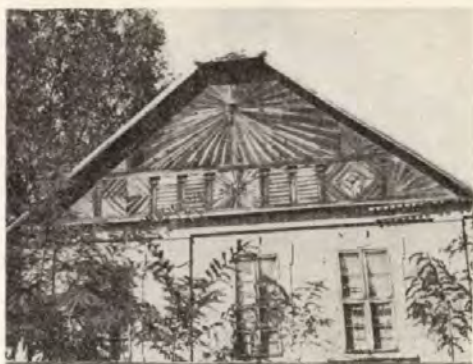
6. Szeged-Alsóváros, Pásztor u. 63. épült 1881