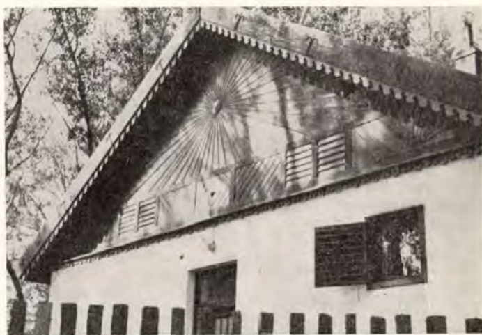
15. Szeged, Kőrössy halászcserda napsugaras oromzata, épült: 1955