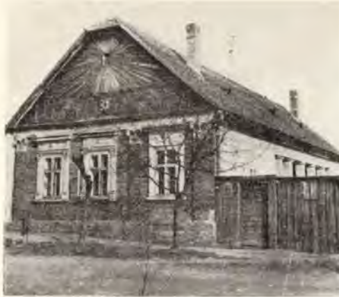
14. Szeged-Alsóváros, Földműves u. 28.

(Az 5., 6., 7., 8., 9., 10., 11., 12., 13., 14., 15., számú fényképeket a szerző készítette). Az 1—2. kép Toppantóné Nagy Czinob Anikó reprodukciója).