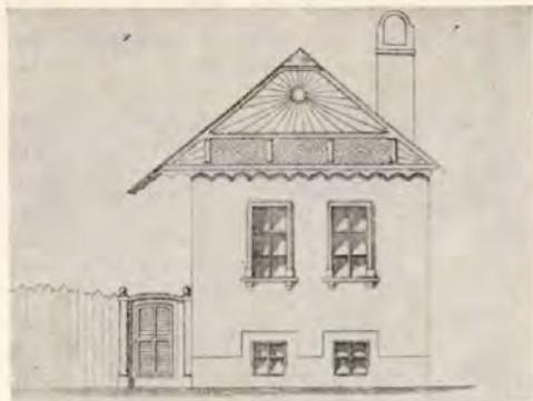
1. Napsugaras ház-homlokzat Lechner Lajos típus-tervei közül