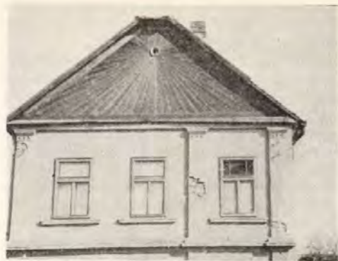
5. Szeged-Móraváros, Veresács u. 8. épült: 1881