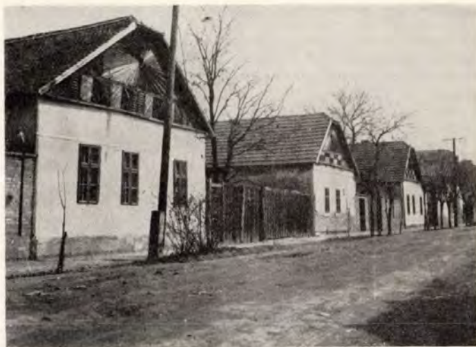
13. Szeged-Alsóváros, Nyíl u. 43—47 sz. utcakép

2. Ugyancsak a 19. században Szegeden számottevő parasztpolgári réteg alakult ki, amelynek a szerepét akkor érthetjük meg, ha az egész szegedi nép — Bálint Sándortól használt régies kifejezéssel „Szögedi nemzet” — egykorú anyagi kultúráját, arculatát ismerjük. A szabad királyi város jobbágyi kötöttségektől mentes földtulajdonos parasztsága — a kedvező értékesítési viszonyok folytán