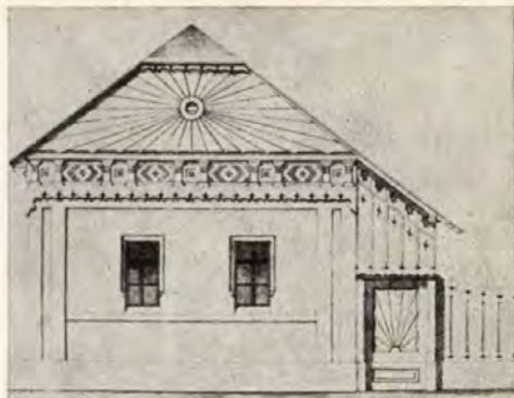
2. Napsugaras ház-homlokzat, Lechner Lajos terve