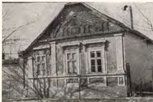
11. Szeged-Alsóváros, Pásztor u. 39.

deszkaoromzatoké —, ami egyrészt az építetők igényességét, másrészt az ácsok szakmai készségét, leleményét példázhatja.