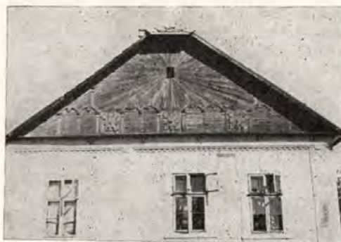
10. Szeged-Alsóváros, Szabadsajtó u. 1, épült: 1883.