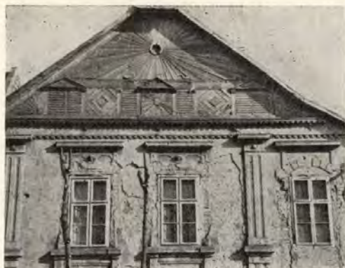
9. Szeged-Alsóváros, Alsónyomás sor