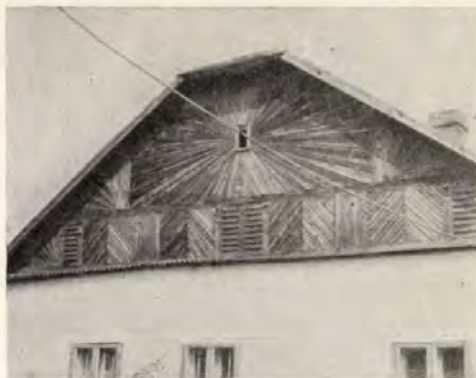
12. Szeged-Alsóváros, Nyíl u. 47.

közölt és fényképarchívumokban felkutatott ábrázolásokat ismerve megállapítható, hogy az oromdíszítés legváltozatosabb formában a szegedi tájon jelentkezett. Ha ennek a gazdasági-társadalmi összetevőit vizsgáljuk, mai ismereteink szerint három körülményt kell kiemelniük: