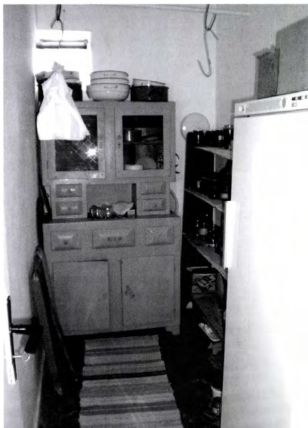
18. kép. „Most mit csináljak, dobjam ki?” Kockaház kamrája az anyóstól örökölt bútorról