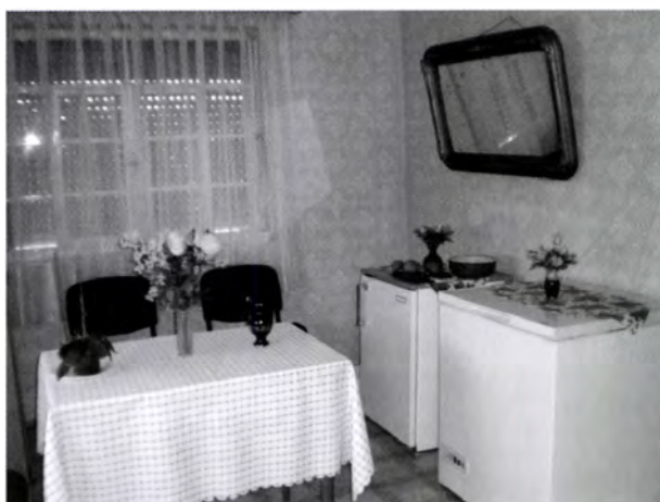
24. kép. Előszoba. Itt tárolják a hűtőládát is

Egyetlen családnál van csak funkciója, ott viszont egyértelműen a reprezentáció. Az előszoba falát díszítik a