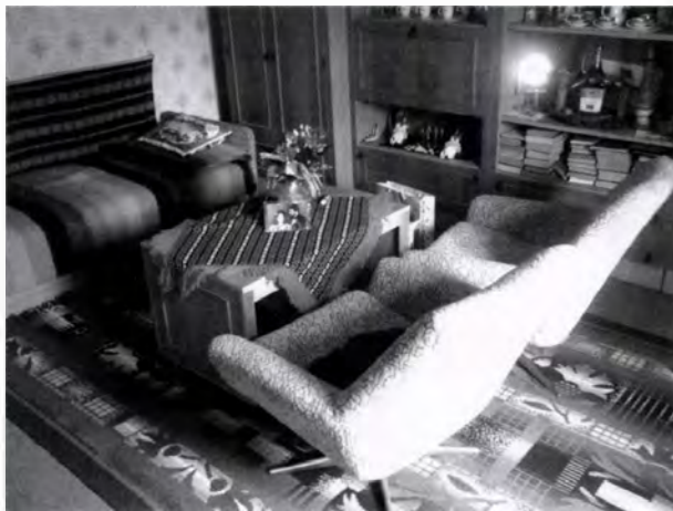
1. kép. Tisztaszoba: középre helyezett, nyolcvanas években vásárolt szekrényoszorhoz tartozó terítővel letakart dohányzóasztal két fotellel, később vásárolt szőnyeggel