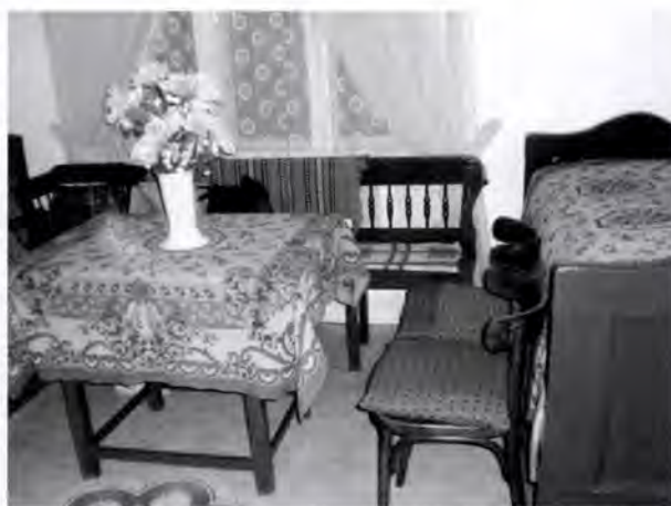
7-8. kép. A hosszúházak tisztaszobájához hasonló tisztaszobának berendezett szoba a kockaházban

zóasztal, egyik oldalán a heverővel, mellette a fotelokkal.