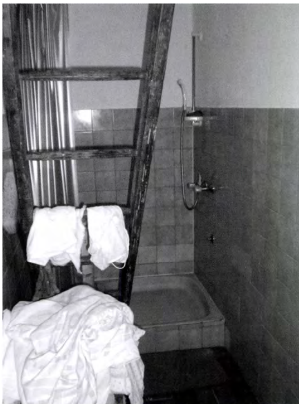
22. kép. Padlásfeljáróból (a konyha mellett) utólagosan kialakított fürdőszoba részlete