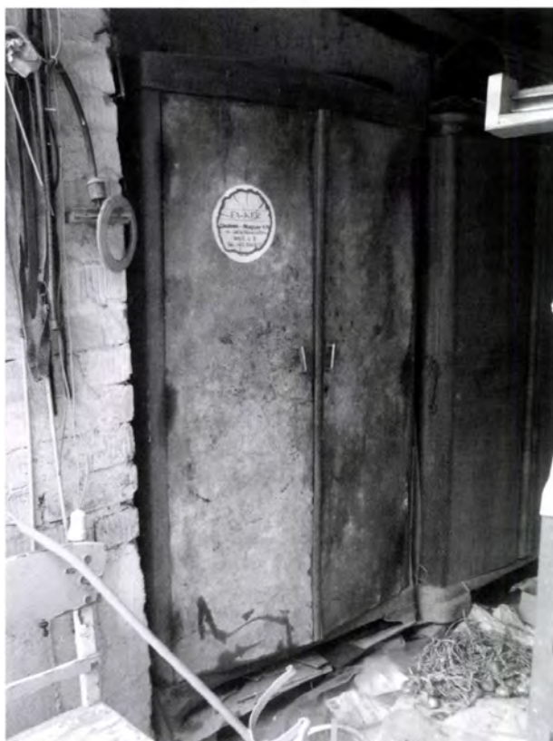
13. kép. A korábbi stafirungba kapott szekrényben már csak szerszámokat tárolnak a műhelyben

A kockaházak itt Bükkzsércen általában két szobával épültek, azonban előfordulhatott, hogy volt még egy szoba az épületben. Ez akkor fordulhatott elő, ha a házba eredetileg tervezett konyha helyett a nyári konyhának tervezett helyiséget használták mindennapos főzésre. Ekkor a „fenti” konyha szobává válhatott, használatában és berendezésében egyaránt. Ebbe a helyiségbe helyezheték el az esetleg szülőktől örökölt bútorokat – a szoba méretéből adódóan már nem abban az elrendezésben, ahogy ott voltak –, és az ágyakat a korábbi elrendezéshez hasonlóan „felágyalva,” a régi takaróval leterítve.