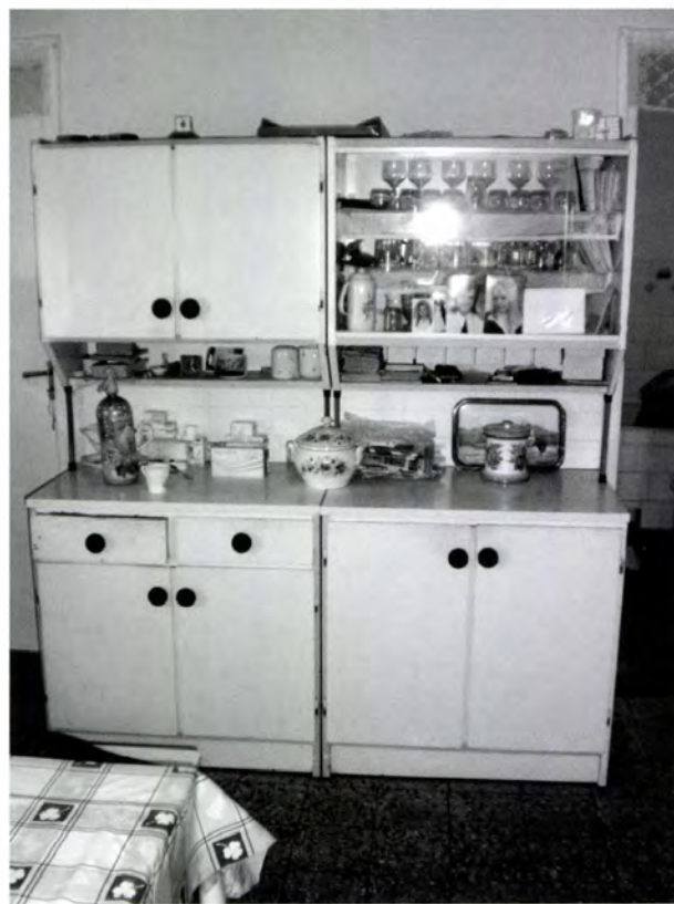
14. kép. Szobaként is használt konyha szekrénye családi fényképekkel, dísztárgyakkal

val, húsvágó székkel, az ajtó melletti vizespaddal. A 19. század vége felé általánossá váltak a nyári konyhák, 90 ahol a meleg évszakokban a sütetést és a főzést végezték, esetleg napközben is itt tartózkodhattak, megkímélve ezzel a lakást a nyári munkák idején. Ide építhették fel a lakó-