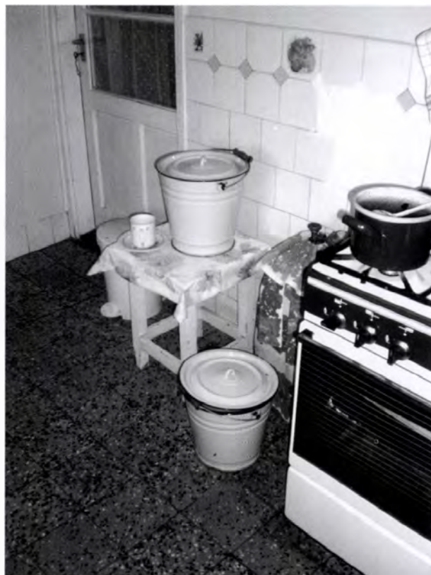
17. kép. „Vizespad” a kockaház konyhájában