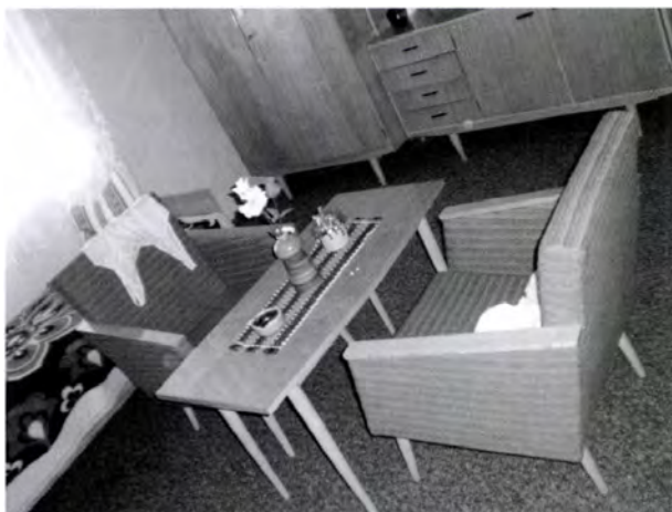
5. kép. Tisztaszoba típusbútorokkal, a szobát a 2000-es évek elején zöldre festették