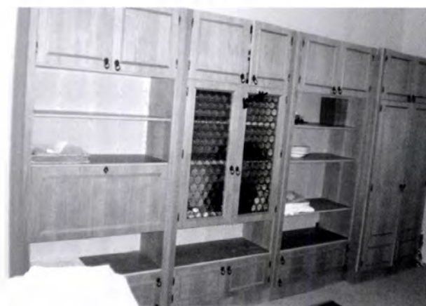
10. kép. Lakószoba. Szekrény sor, amit a tulajdonos lánya stafiringként elvitt magával Egerbe, majd egy lakásfelújítás után nem dobták ki, hanem visszakerült az eredeti helyére

A bútorok vándorlását, az asztalos ládák megjelenésével az ácsolt ládák tornáczra, padlásra kerülését jól ismerjük a néprajzi szakirodalomból. Ehhez hasonló a gyáripari bútorok és a tömegtermelés megjelenésével a kézművesipar termékeinek, így az 1950-es évek hálószoba garnitúráinak kiszorulása is. 87 A bútorok kiszorulásának, funkcióváltásának lépései a következők: