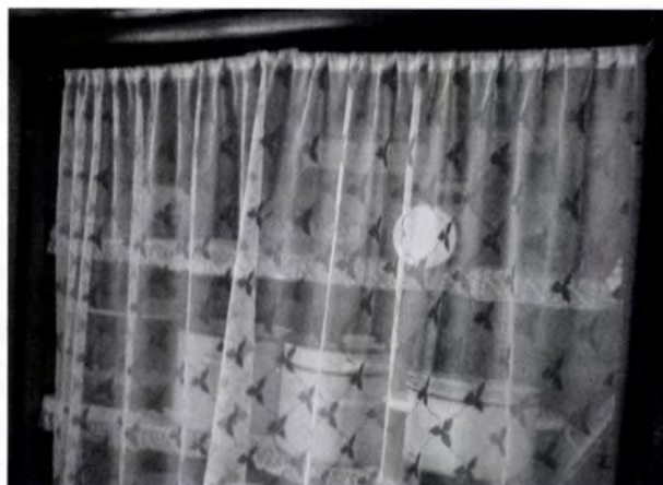
11. kép. Az ötvenes évekbeli hálószobabútor garnitúra egyik szekrényéből készített tároló nagyméretű edények számára