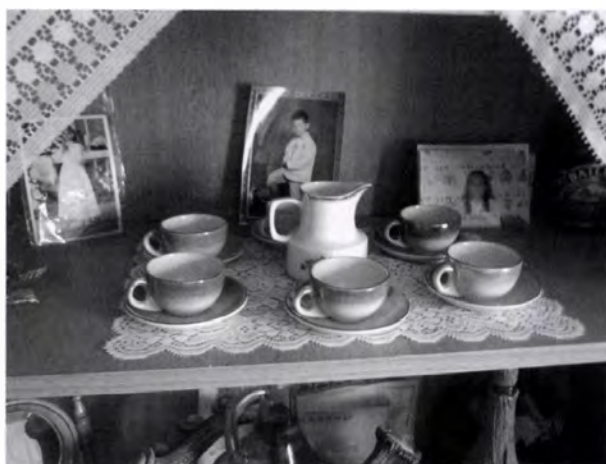
4. kép. A szekrényoszor emléktárgyakkal és családi fotókkal

Ezek a szobák a parasztházak szobáival ellentétben már nem látnak el minden funkciót. Általában a ház egyik szobája, a tisztaszoba a reprezentáció tere, a másik pedig a lakószoba, itt aludtak, valamint ezekben a szobákban helyezték el később a televíziót. Étkezésre, tisztálkodásra sem ezeket a helyiségeket használták, az új épületekben ezek a tevékenységek önálló helyet kaptak.