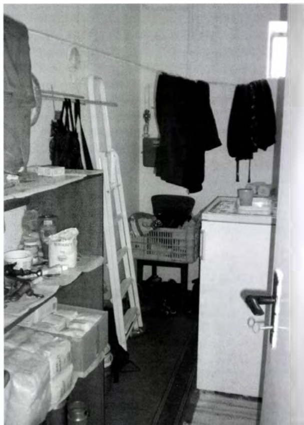
19. kép. Eredetileg fürdőszobának épített helyiség, amiből a szanitereket már eladták, jelenleg kamraként használják