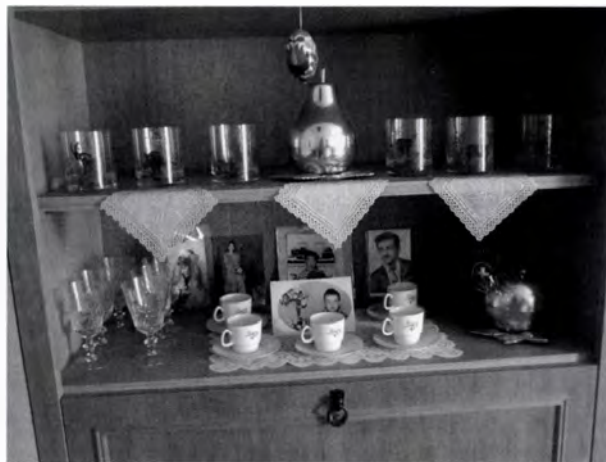
3. kép. A szekrényoszor emléktárgyakkal és családi fotókkal