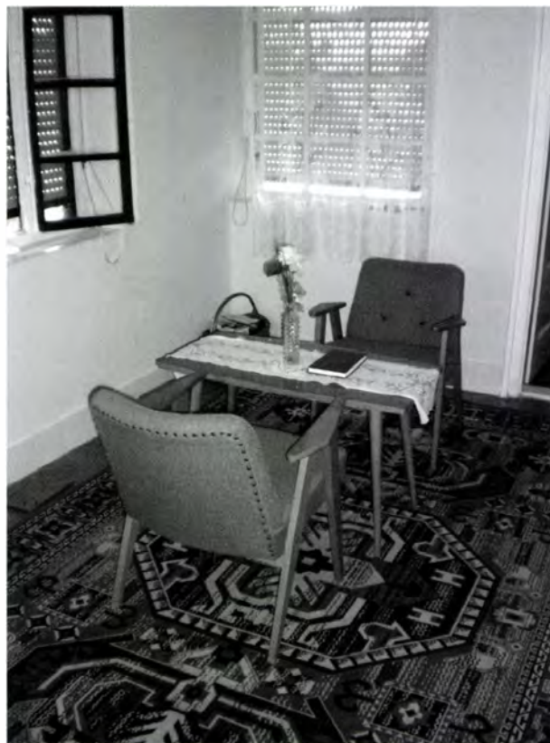
23. kép. Előszoba, „de minek”