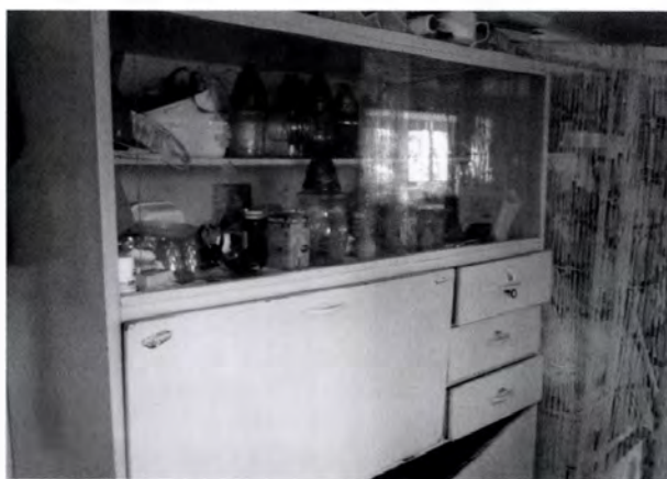
12. kép. A konyhabútor már csak a műhelyben használják