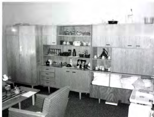
6. kép. Tisztaszoba szekréneysora ajándék- és dísz tárgyakkal, rajta a pohárkészlettel, amit a tulajdonos „kiváló dolgozó” oklevéllel együtt a termelőszövetkezetből kapott

előre a két szoba. A ház beosztása hasonló, mint Sz. A-né házáé, azonban a konyhát nem a fürdőszoba és a kamra közelében, hanem a hátsó szoba végében alakították ki. Éppen ezért az utca felőli szoba lett a tisztaszoba. A hátsó szoba pedig – amit folyamatosan használtak, mert keresztül kellett rajta menni, hogy a kamrából a szükséges alapanyagokat, eszközöket elővehessék – lakószobává vált. A háznak két bejárata van: az egyik a konyhából nyílik, ezt használják a családtagok, de a vendégek is. 55 A konyhát azonban csak utólag, toldással építették a házhoz, eredetileg a hátsó szobát tervezték konyhának. 56