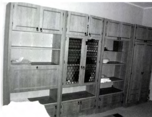
25. kép. Szekrény, amit a család stafíringként a lánynak adott, aki lakásuk átalakítása után visszahozta a bútort az eredeti helyére