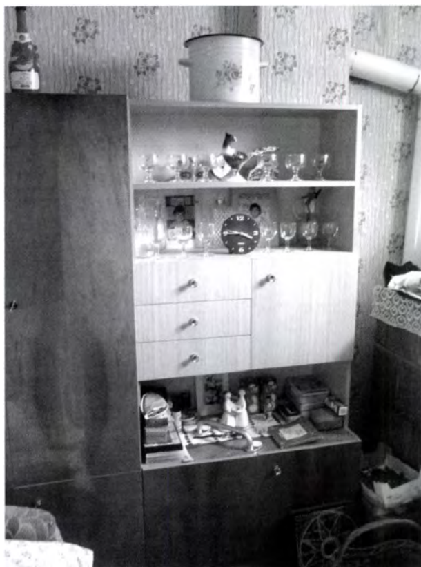
9. kép. A kockaház konyhájából kialakított lakószoba az idős családtagoknak

gyon nagy értékűek, minden tárgynak története van, legtöbbször nem is a használati funkciója, presztízsjellege miatt kerül a házba, hanem sokkal inkább szimbolikus értéke miatt. 74 Ilyenek például a saját készítésű tárgyak.