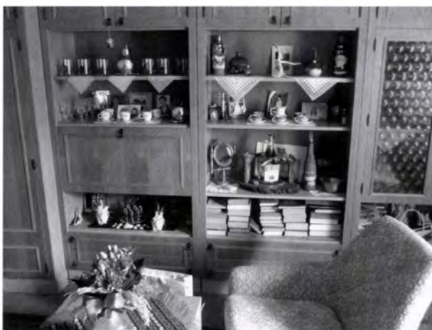
2. kép. Szekrényoszor a tisztaszobában. A szekrényoszorra családi fotókat, emléktárgykat, könyveket tettek