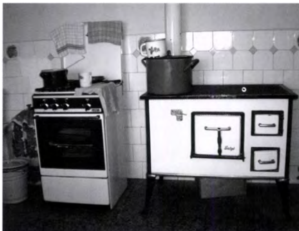
15. kép. Gáztűzhely és sparhelt mindennapos használatban a szobaként is használt konyhában (SZIGETHY Zsófia felvétele)