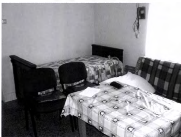
16. kép. Szobaként használt konyhában a vetett ágy (a tulajdonos még az anyósa anyósától örökölte) és a heverő, ahol a tulajdonos alszik, előtte kiselejtezett irodai székekkel

konyhát rendszeresen használták, a házban kialakított konyha szobaként funkcionált. Be lehetett rendezve konyhabútorral, de nem volt jellemző, hogy itt főztek volna.