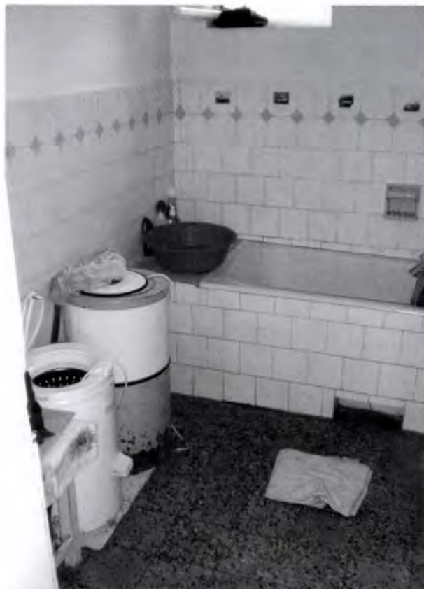
20. kép. Kockaház fürdőszobája szaniterekkel.

A házba nincs bevezetve a vezetékes víz, a fürdőszobát azonban „rendeltetésszerűen” használják