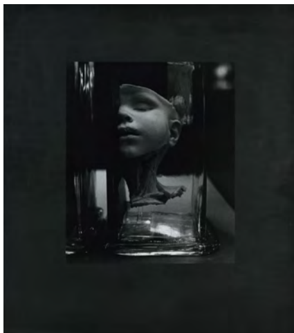
DROZDIK Orshi Végtelen disztópia, 0004, Black Mirror (Fekete tükör) Dystopia Infinite, 0004, Black Mirror, 1984

zselatinos ezüst | gelatine silver print; 60 × 50 cm (102 × 92 cm) Ludwig Múzeum - Kortárs Művészeti Múzeum, Budapest