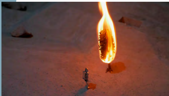
Oto HUDEC Hullám a kert előtt | Wave in Front of the Garden, 2019

HD videó (állókép) | video (video still); 3'39" Ludwig Múzeum - Kortárs Művészeti Múzeum, Budapest (Az aacheni Peter und Irene Ludwig Stiftung letétje | Long-term loan from the Peter und Irene Ludwig Stiftung, Aachen)