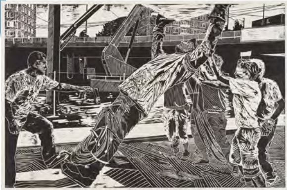
CSÁKÁNY István Talpra állítás | Erecting, 2008

French anthropologist Marc Augé captured one of the fundamental experiences of space use in late modern societies with his concept of non-places (non-lieux). According to his definition, non-places are spaces that have no identity-based, historical, or relational significance: they are transitory, functional, and impersonal. As spaces of transportation, consumption, and administration, they are pivotal locations of everyday life, yet they lack everything that makes a 'place' meaningful in Augé's interpretation. They