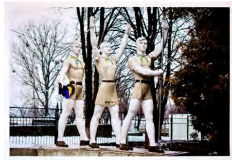
Jevhen NYIKIFOROV | Jevgeny NIKIFOROV A köztársaság emlékműveiről - Az aktivisták által átfestett úttörők emlékműve Novovolinszk (Volinyi régió) | On Republic's Monuments - Monument to pioneers, painted by activists, Novovolynsk, Volyn region, 2016

The end of ideologies can first be recognized by its symptoms of crisis: the loss of grand narratives, the inability of