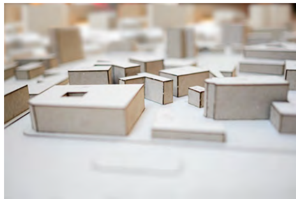
Ciprian MUREȘAN Bukarest városmodell (részlet) Bucharest City Model (detail), 2014/2026

The built environment is a direct reflection of social structures, and vice versa: spaces designed to facilitate coexistence may seem ideal on paper and offer solutions to a variety of problems, but in reality, over the decades, they can turn into a complete social nightmare. The disposal of urban spaces, the memory and stratification of spaces, and the personal narratives associated with them appear in the works in this section.