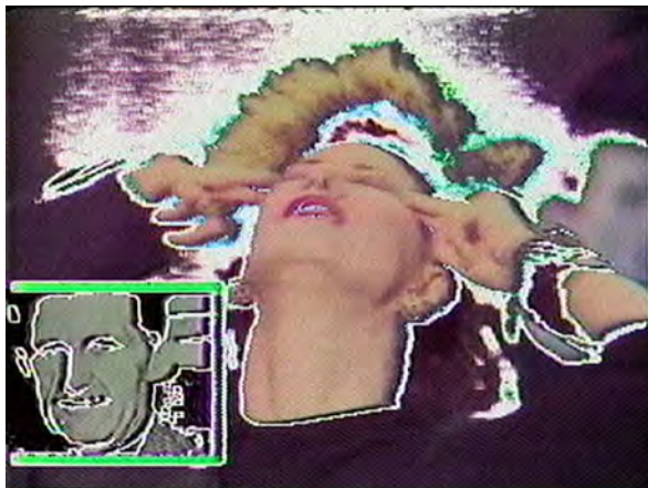
Nam June PAIK Jó reggelt, Mr. Orwell | Good Morning, Mr. Orwell, 1984

A „fekete tükör” fogalma a kortárs kultúrában elsősorban a kikapcsolt digitális kijelzők sötét felületére utal. Ebben a jelentésben a fogalom a digitális technológiák jelenlétének és sebezhetőségének emblémájává vált: a hibajelenségek, lefagyások vagy teljes rendszerleállások („fekete halál”) jelölőjeként. Kulturális elterjedéséhez jelentősen hozzájárult Charlie Brooker Black Mirror című, disztópikus hangvételi sorozata, amely a sötét képernyőt a technológiai önreflexió metaforájaként alkalmazza. A kikapcsolt kijelzőben egyszerre látjuk saját arcunkat és a technológia ránk irányuló tekin-