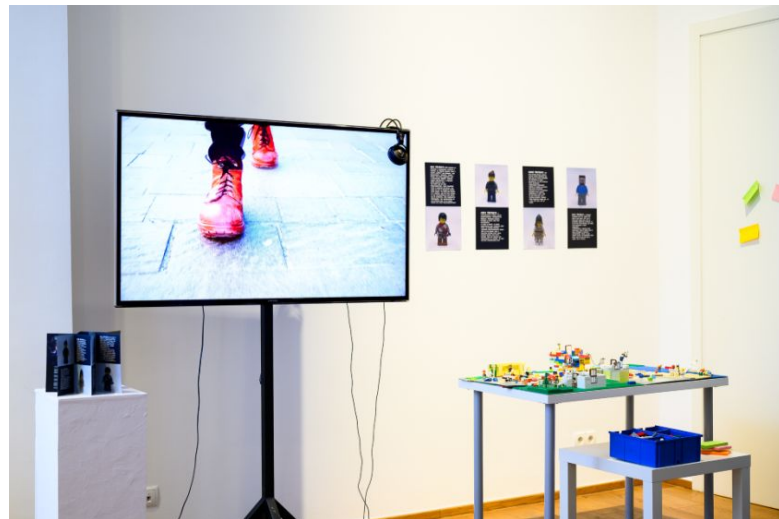
Fejhallgató csapat Kapcsolatok című munkája