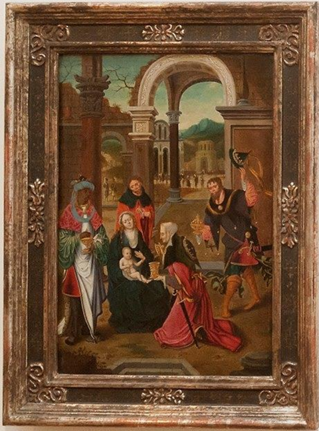
Pieter Bruegel the Elder The Adoration of the Kings Medium: Oil on copper, 1568 Dimensions: 11.5 x 16.5 cm Inventory No. 1568 Location: Room 101 This painting is a reproduction of the original work by Pieter Bruegel the Elder, which is housed in the Kunsthistorisches Museum in Vienna. The original work is a small, square-format oil painting on copper, measuring 11.5 x 16.5 cm. It depicts the Adoration of the Kings, a scene from the Nativity story. The infant Jesus is shown lying on the ground, being worshipped by three kings. The scene is set in a courtyard with a large archway in the background. The painting is a reproduction of the original work by Pieter Bruegel the Elder, which is housed in the Kunsthistorisches Museum in Vienna.